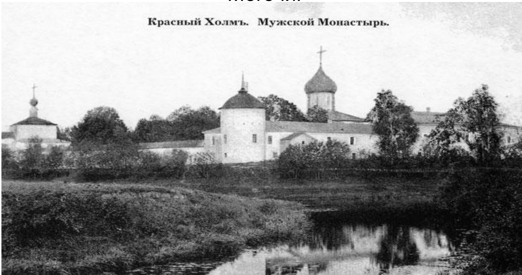
Красный Холмъ. Мужской Монастырь.

расположен в деревне Слобода Краснохолмского р- на Тверской области у слияния рек Неледины и Могочи.