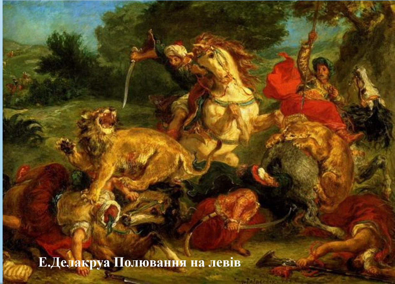
Е.Делакруа Полювання на левів