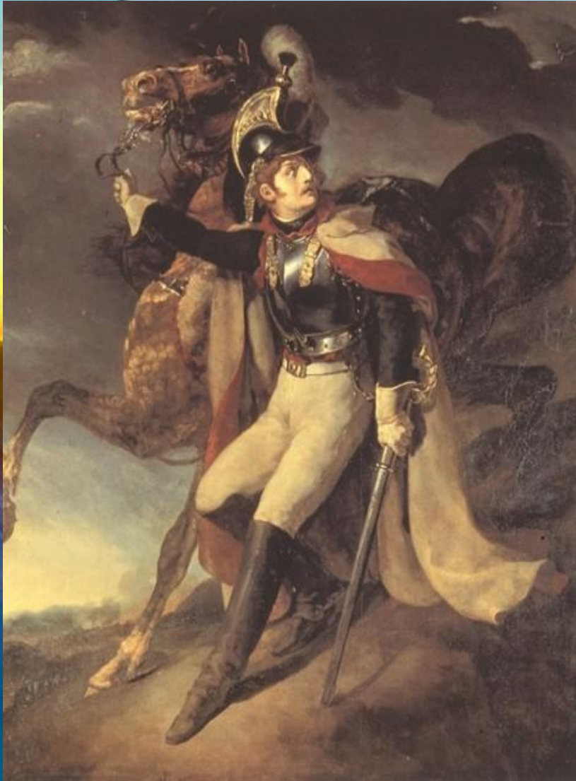
Т.Жеріко “Ранений кірасир”