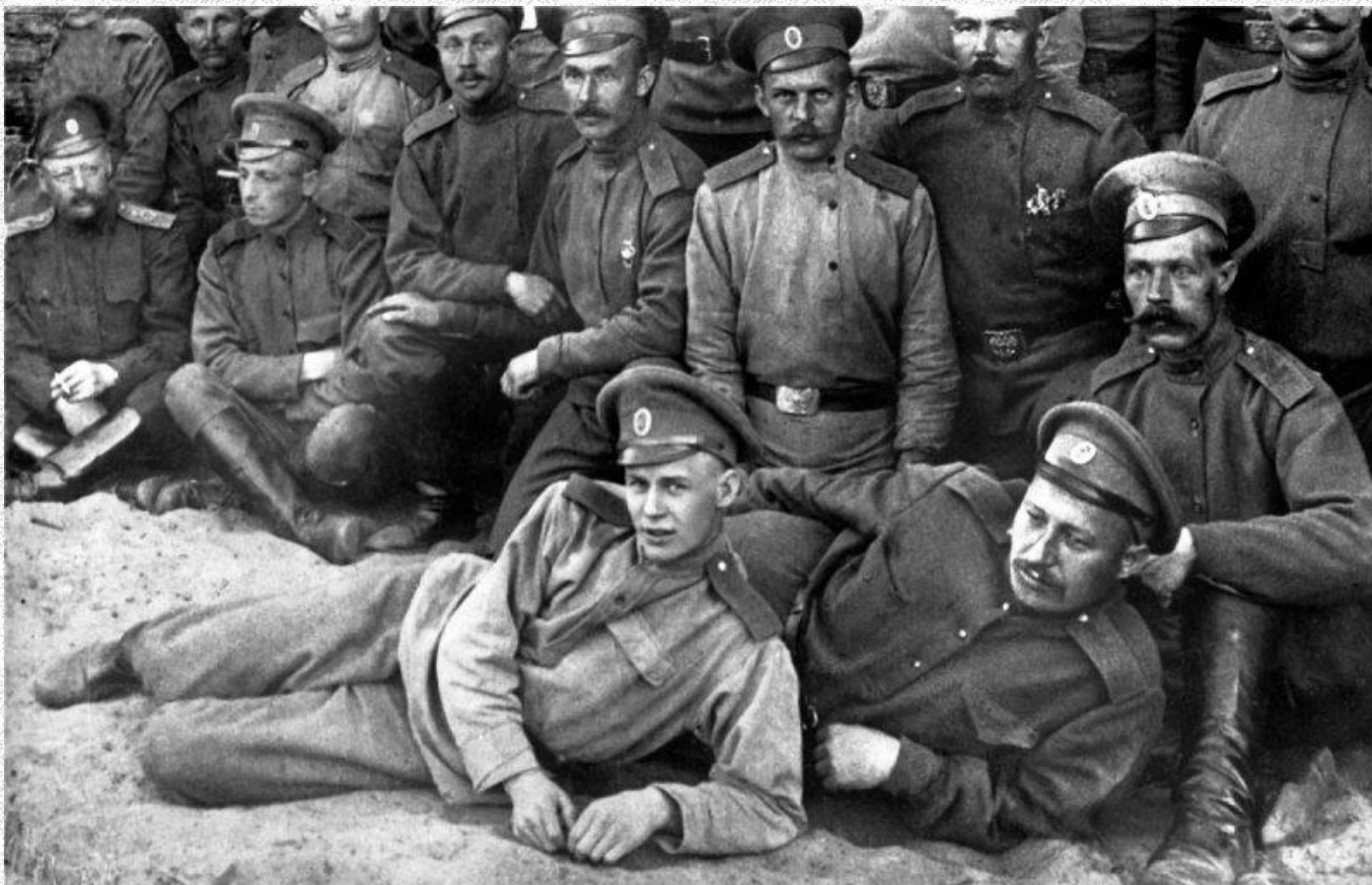
С. А. Есенин среди персонала полевого Царскосельского военно-санитарного поезда № 143. 1916 г., июнь. Черновцы.

В январе 1916 года Есенина призвали на военную службу. Весной молодого поэта приглашают читать стихи императрице, что в будущем помогает ему избежать фронта.