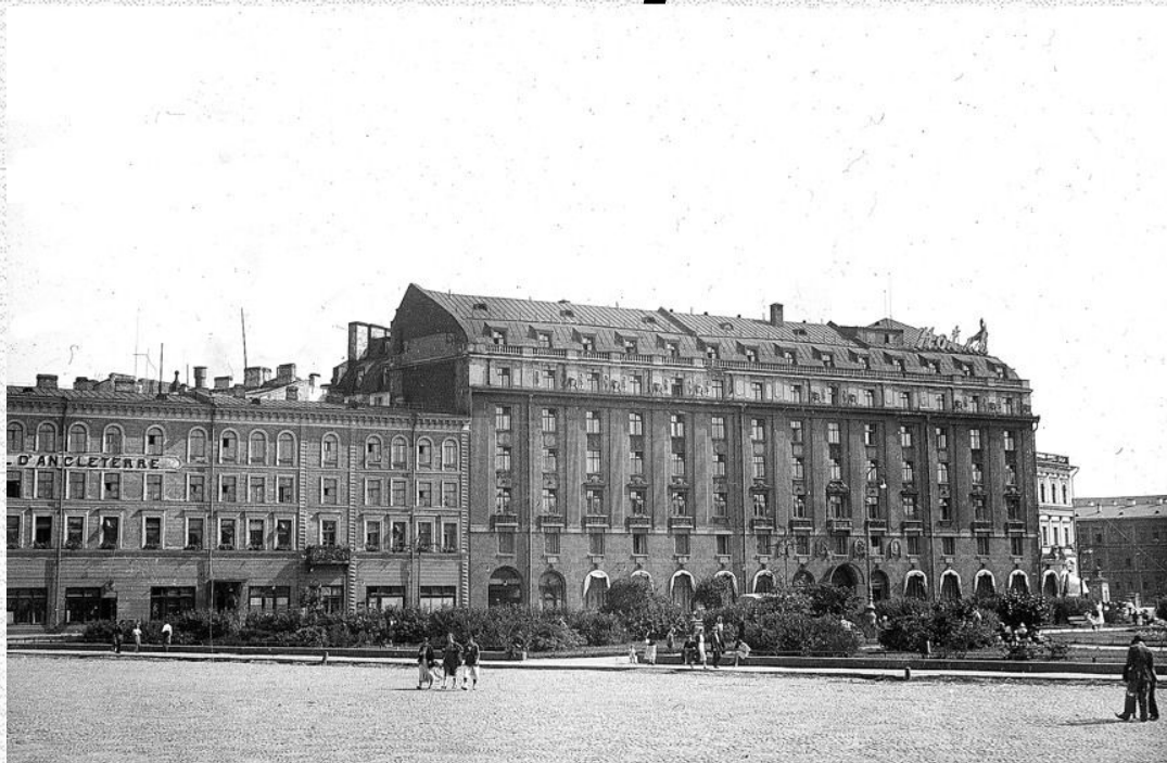
Гостиница Англетер (слева)

Л. Прервав курс лечения, 23 декабря Есенин поехал в Ленинград, где в ночь на 28 декабря в состоянии глубокой душевной депрессии в гостинице «Англетер» повесился. Последнее его стихотворение — «До свиданья, друг мой, до свиданья...» — было написано в этой гостинице кровью поэта.