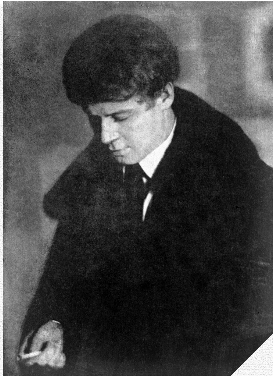
Сергей Есенин в 1924 году

В 1924-25 гг. Есенин пишет такие известные стихотворения, как "Русь уходящая", "Письмо к женщине", "Письмо матери", "Стансы"; цикл "Персидские мотивы".