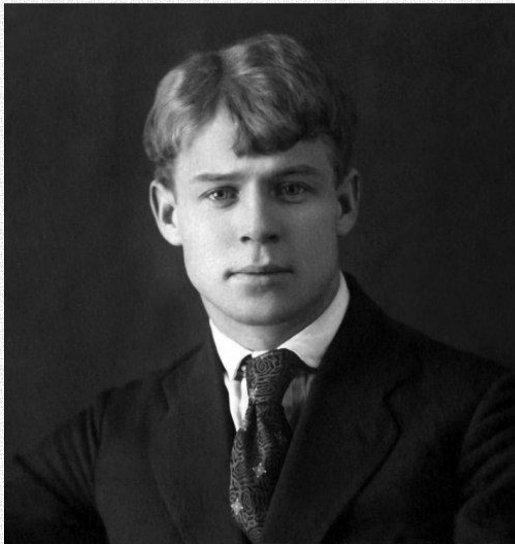
Сергей Есенин, конец 1921 - начало 1922 года

В 1921 году поэт отправился в путешествие по Средней Азии, посетил Урал и Оренбуржье.