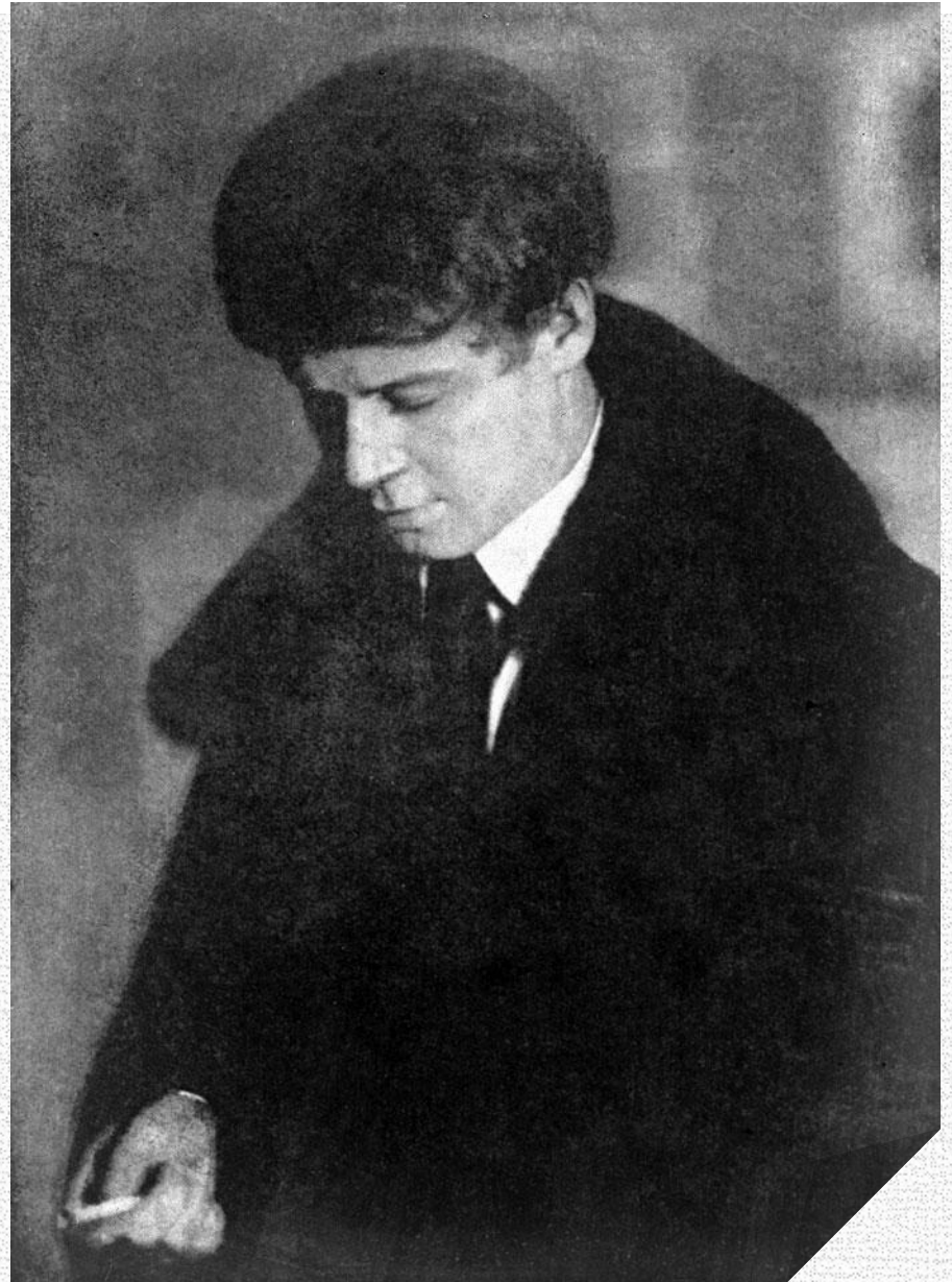
Сергей Есенин в 1924 году

В 1924-25 гг. Есенин пишет такие известные стихотворения, как "Русь уходящая", "Письмо к женщине", "Письмо матери", "Стансы"; цикл "Персидские мотивы".