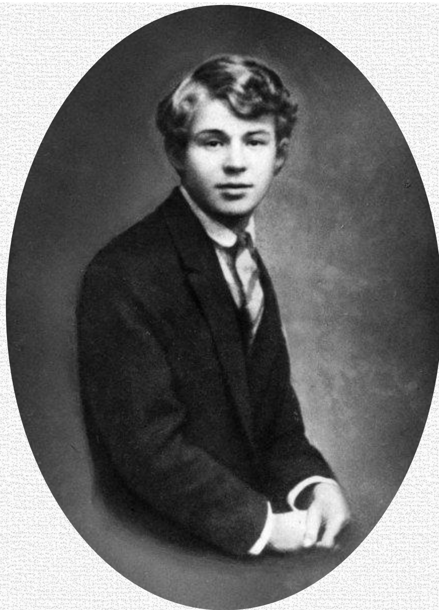
Сергей Есенин в 1913 году