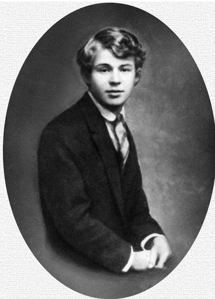
Сергей Есенин в 1913 году