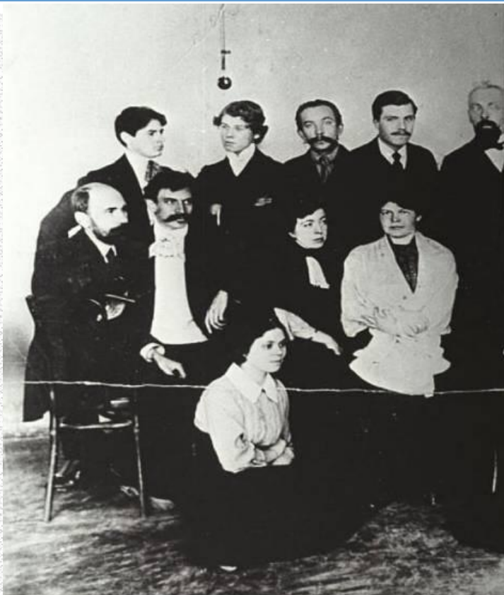
Сергей Есенин с работниками типографии, 1914 год

В Семнадцать лет уехал в Москву, где работал корректором в типографии; продолжал писать стихи. В 1912 году поступил в Народный университет А. Шанявского на историко-философское отделение, где проучился полтора года.