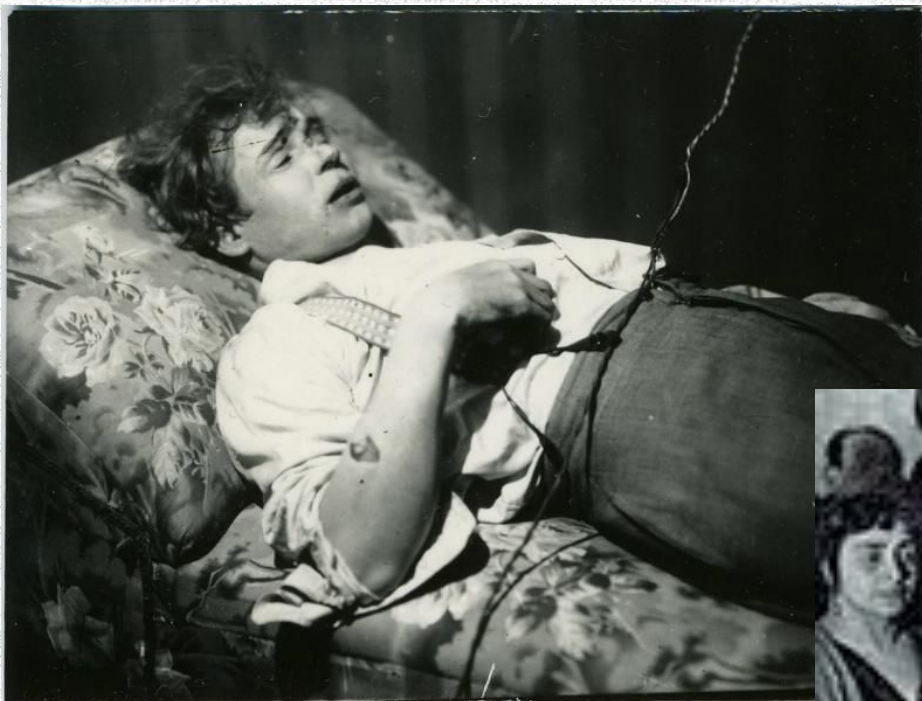
Посмертное фото Есенина