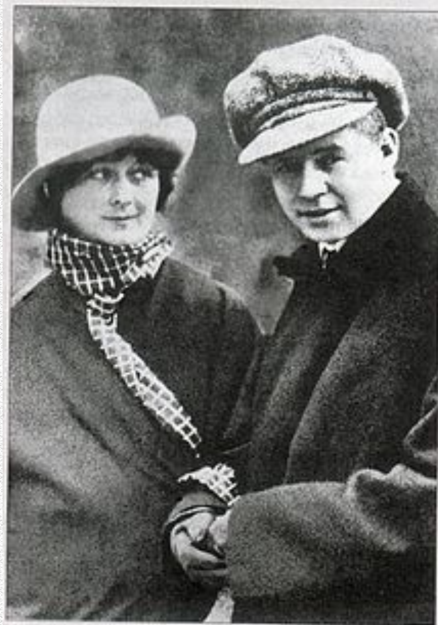
Айседора Дункан и Есенин. 1922 г.

Газета «Известия» опубликовала записи Есенина об Америке «Железный Миргород». Брак с Дункан распался вскоре после их возвращения из-за границы.