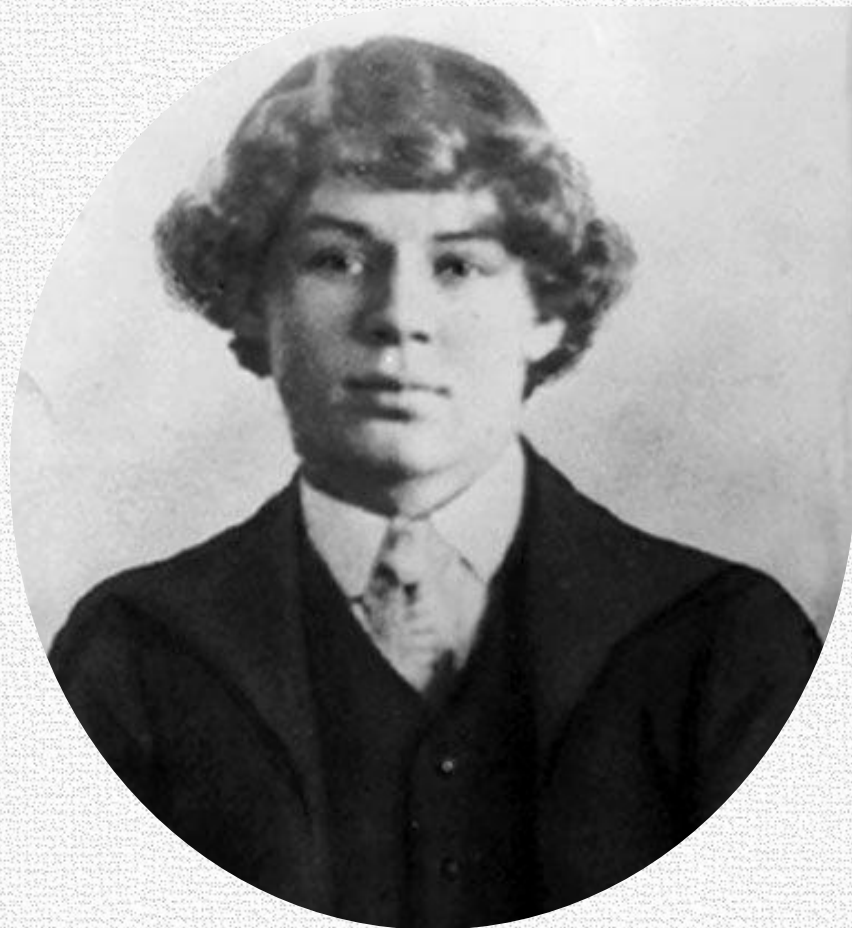
Есенин, 1914 год, Москва

В Семнадцать лет уехал в Москву, где работал корректором в типографии; продолжал писать стихи. В 1912 году поступил в Народный университет А. Шанявского на историко-философское отделение, где проучился полтора года.