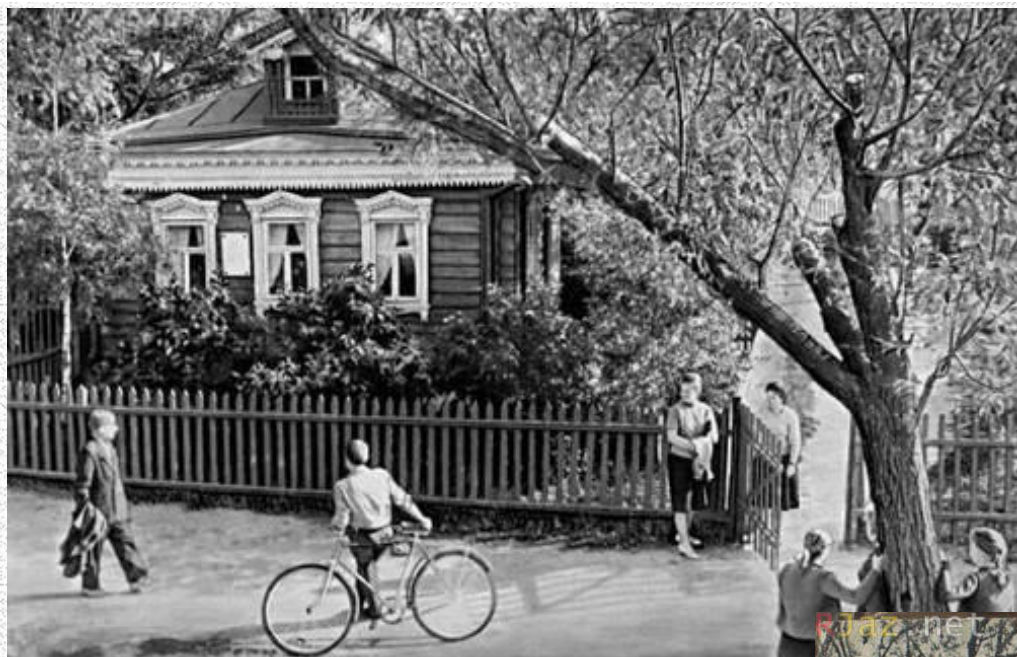
Село Константиново Рязанская губерния. Дом, где родился С.А. Есенин