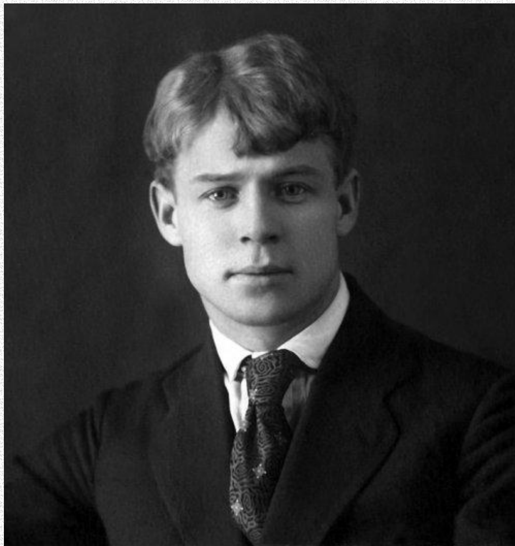
Сергей Есенин, конец 1921 - начало 1922 года

В 1921 году поэт отправился в путешествие по Средней Азии, посетил Урал и Оренбуржье.