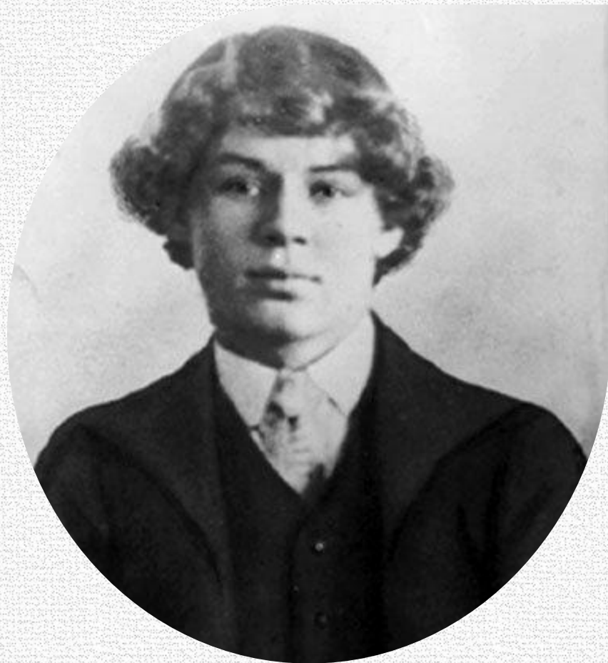
Есенин, 1914 год, Москва

В Семнадцать лет уехал в Москву, где работал корректором в типографии; продолжал писать стихи. В 1912 году поступил в Народный университет А. Шанявского на историко-философское отделение, где проучился полтора года.