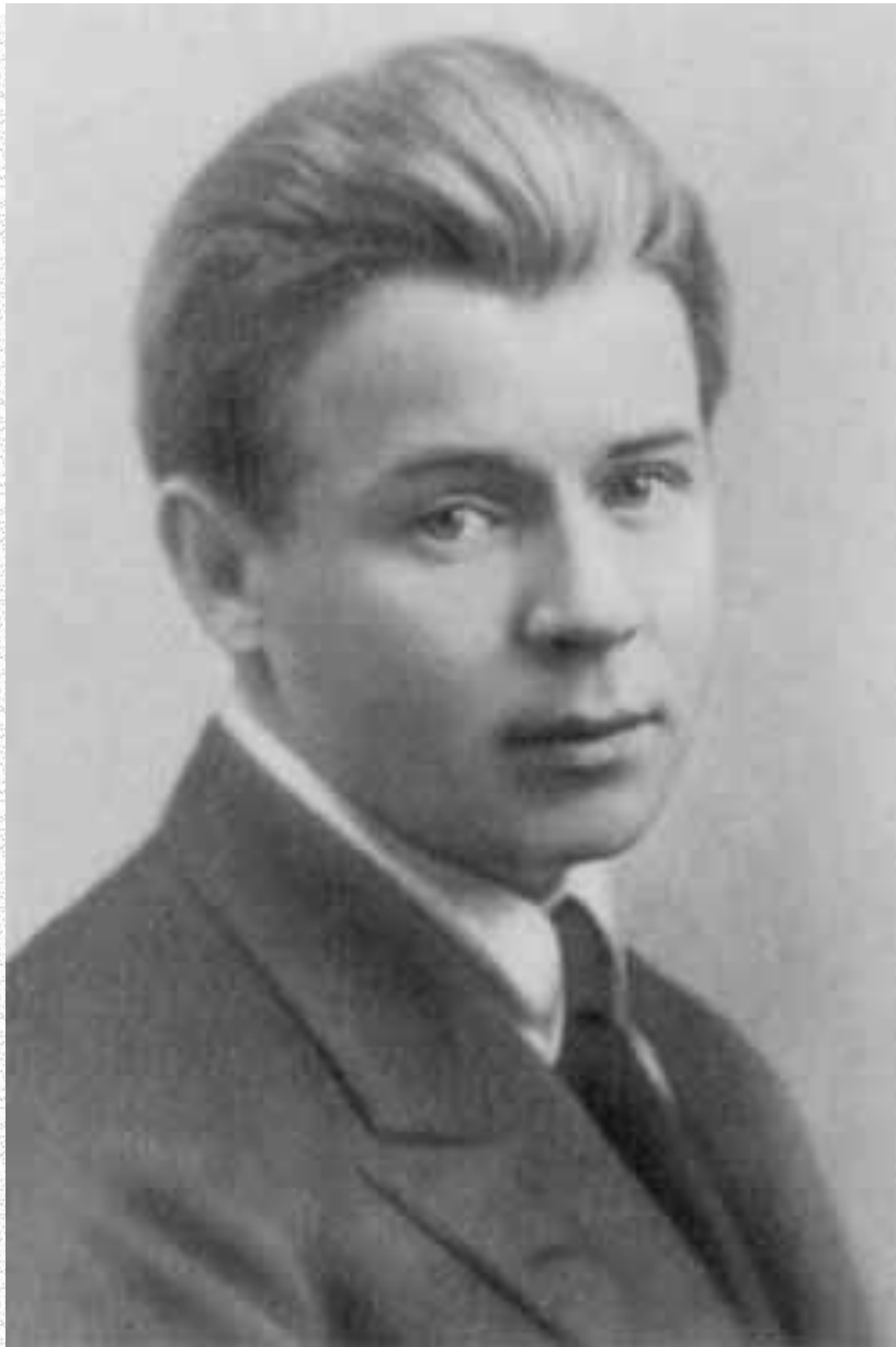
Сергей Есенин в 1925 году

В одной из последних поэм «Страна негодяев» Сергей Александрович очень резко пишет о лидерах России, что влечёт за собой критику публикаций поэта и запрет на них.