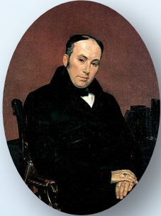
В. А. Жуковск ий