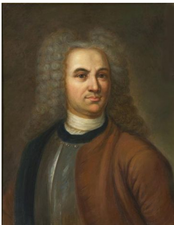
Василий Никитич Татищев (1686 - 1751)