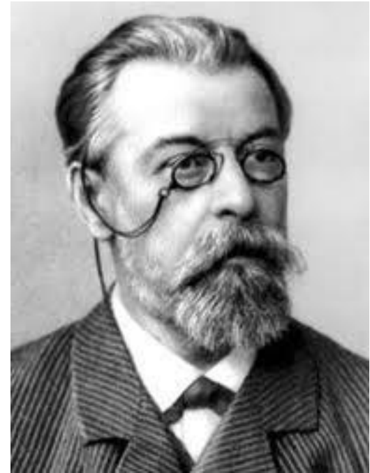
Сербский Владимир Петрович (1858

– выступал инициатором создания первой психологической лаборатории при Московском университете