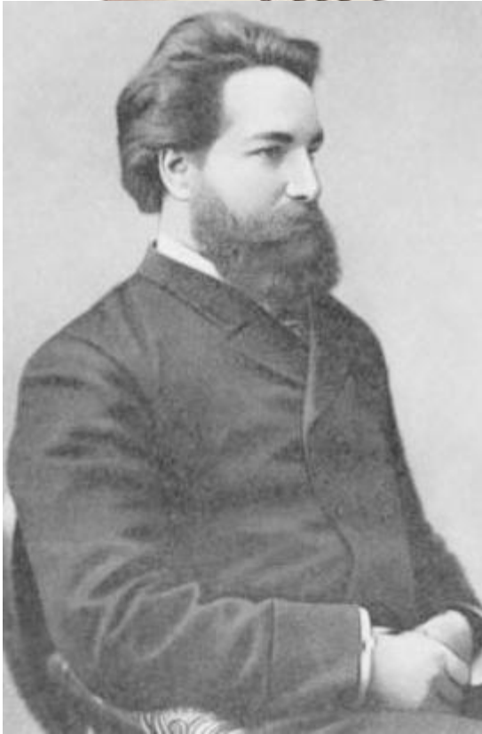
Корсаков Сергей Сергеевич (1854 - 1900)

– выступал инициатором создания первой психологической лаборатории при Московском университете