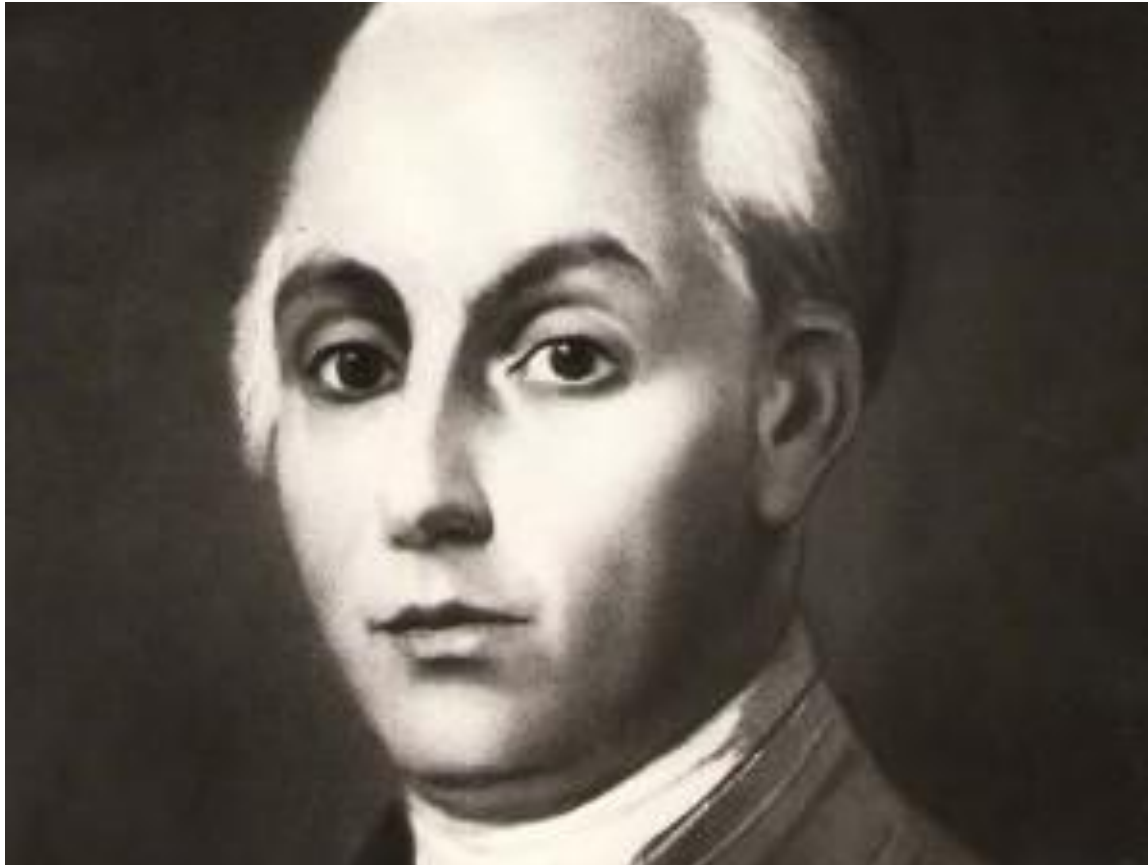
Александр Николаевич Радищев