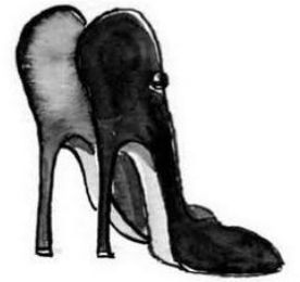
zapatos de tacón