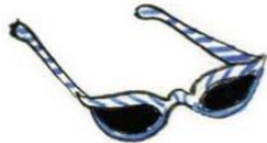
gafas de sol