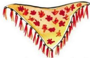
echarpe / chal