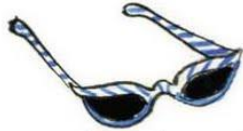
gafas de sol