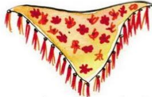
echarpe / chal