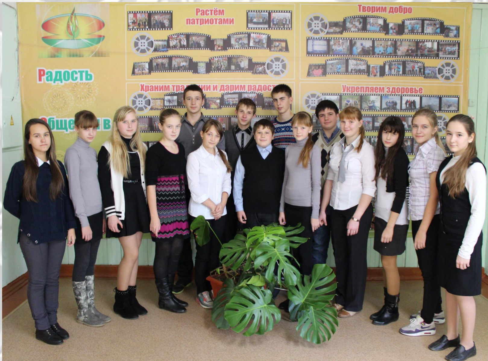
Краеведы-экскурсоводы историко-краеведческого музея МБОУ «Лицей №3»