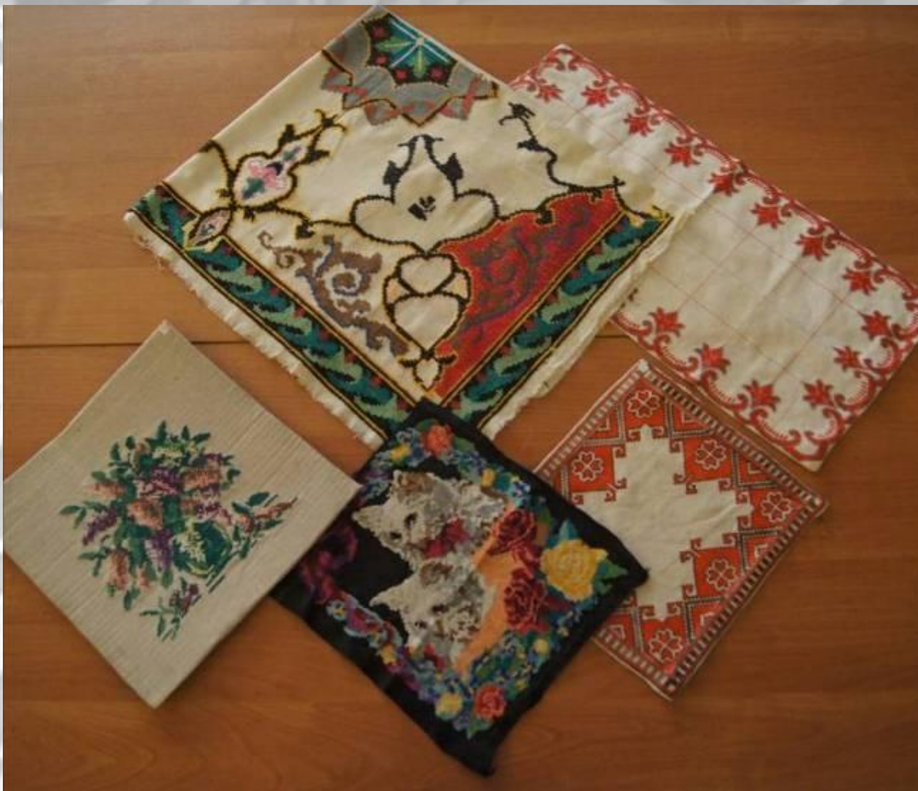
САЛФЕТКИ, 60-70 гг. XX века вышивка, техника «Простой крест»