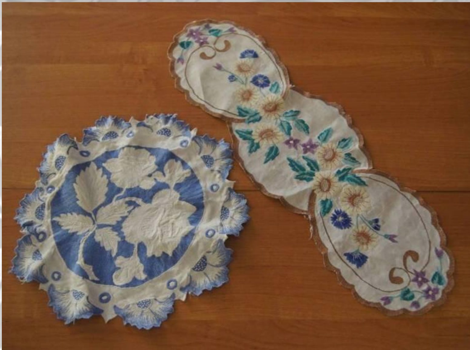
САЛФЕТКИ, 70-е гг. XX века вышивка, техника «Гладь»