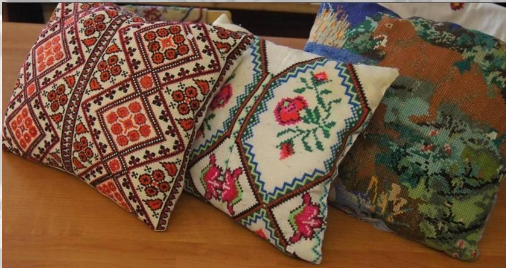
ДУМКИ, 60-70 гг. XX века вышивка, техника «Простой крест»