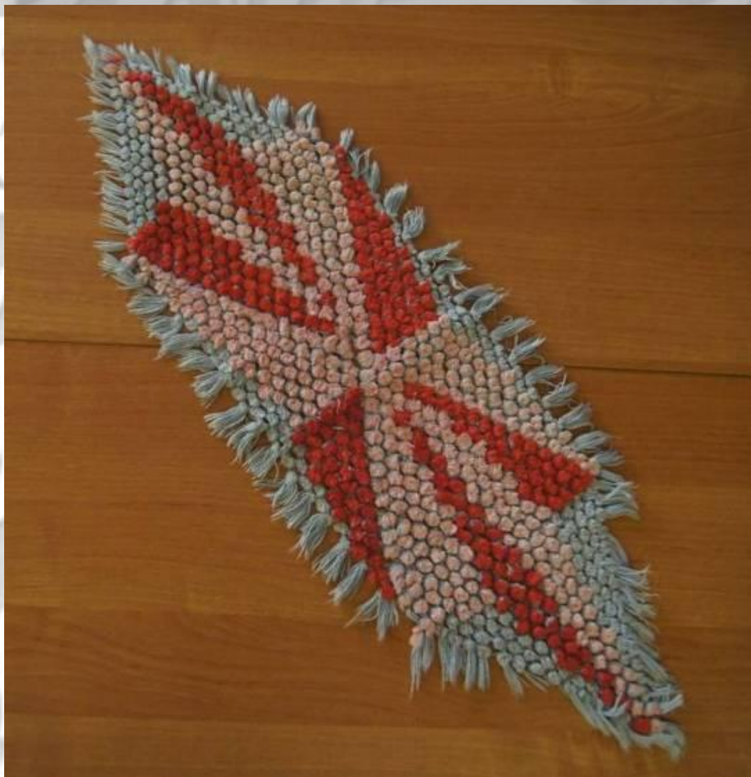
САЛФЕТКА, I-я половина XX века техника «Плетение на рамке»