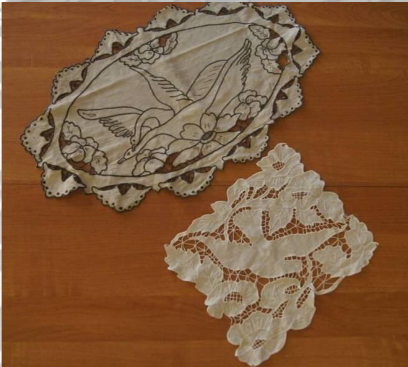
САЛФЕТКИ, конец XIX века вышивка, техника «Ришелье»