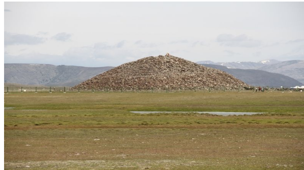
Погребение, курган, захоронение