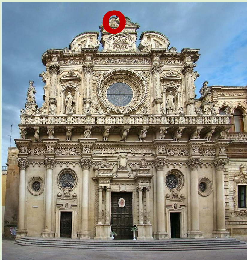
Базилика дель Санта Кроче, Лечче, Италия.