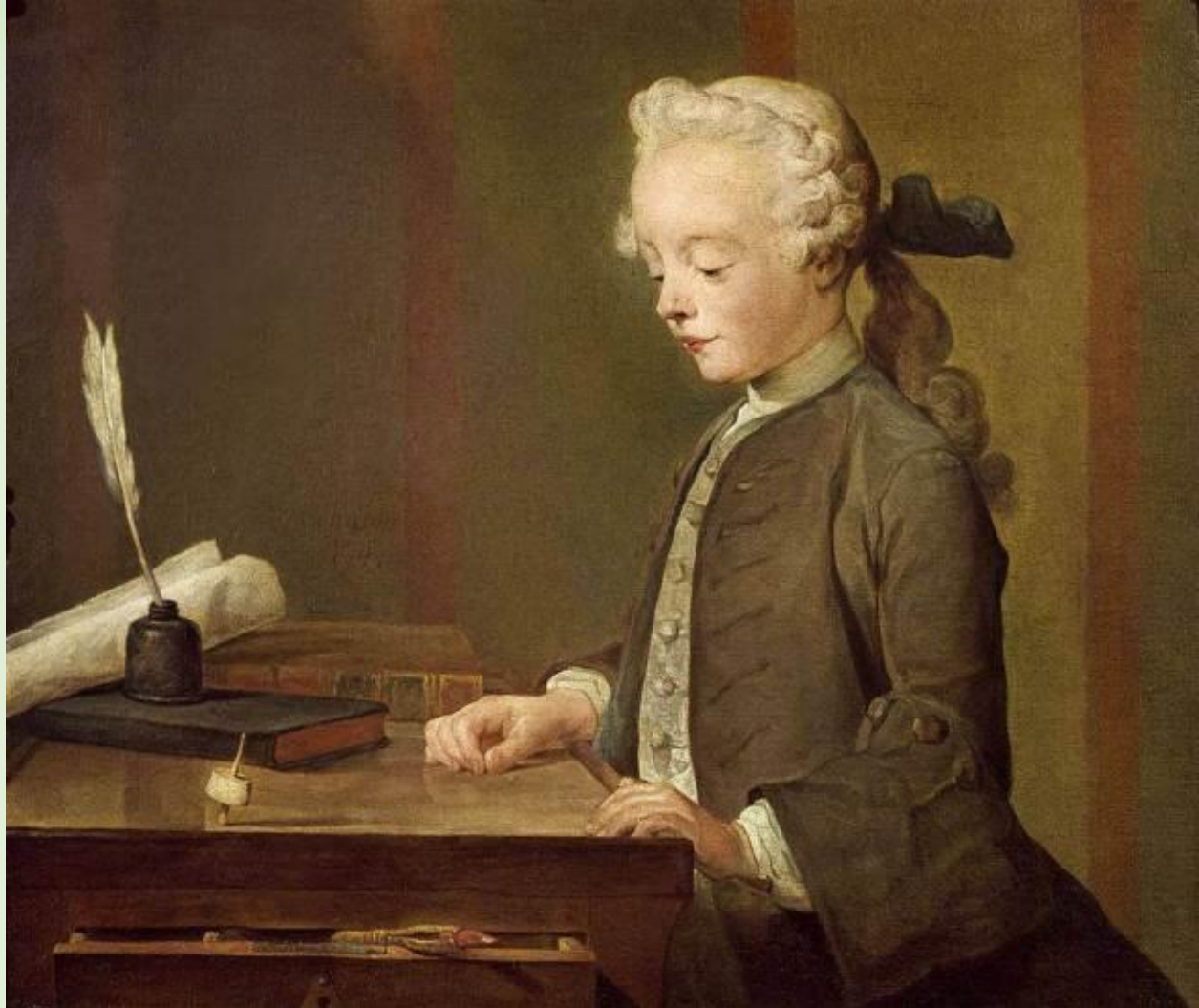
Ж-Б Шарден. Мальчик с юлой.

Меняется отношение к образованию. Под влиянием научной революции мир перестает восприниматься как опасный и непредсказуемый. Познавая его законы люди учатся его менять. Возникает идея, что точно также можно и нужно изменять человека. Появляется литература, посвященная воспитанию. Открываются учебные заведения.