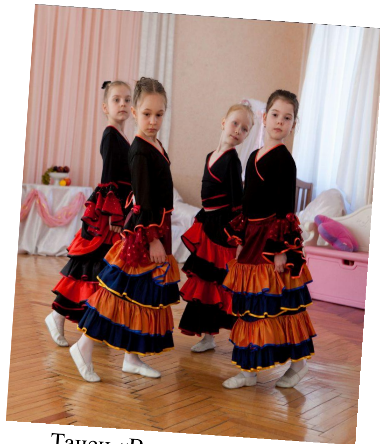
Танец «В старинном замке»