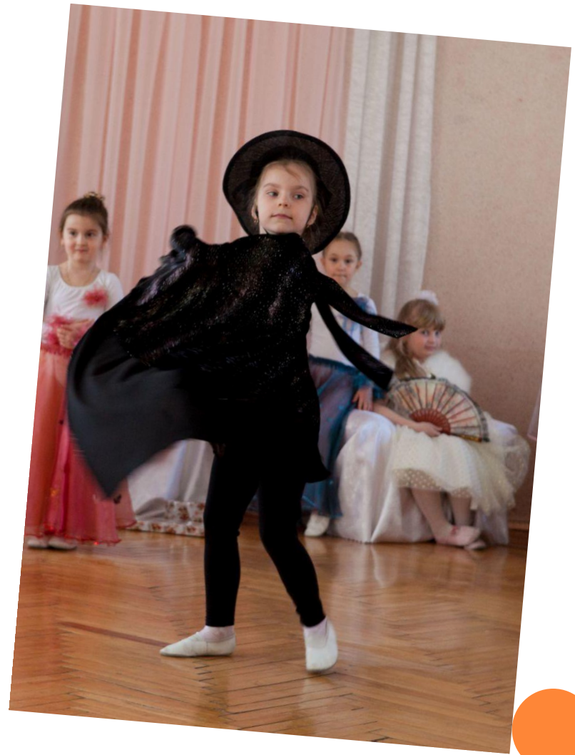
Злая фея Карабос