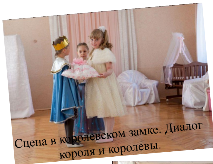
Сцена в королевском замке. Диалог короля и королевы.