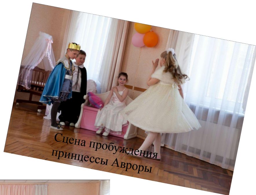
Сцена пробуждения принцессы Авроры