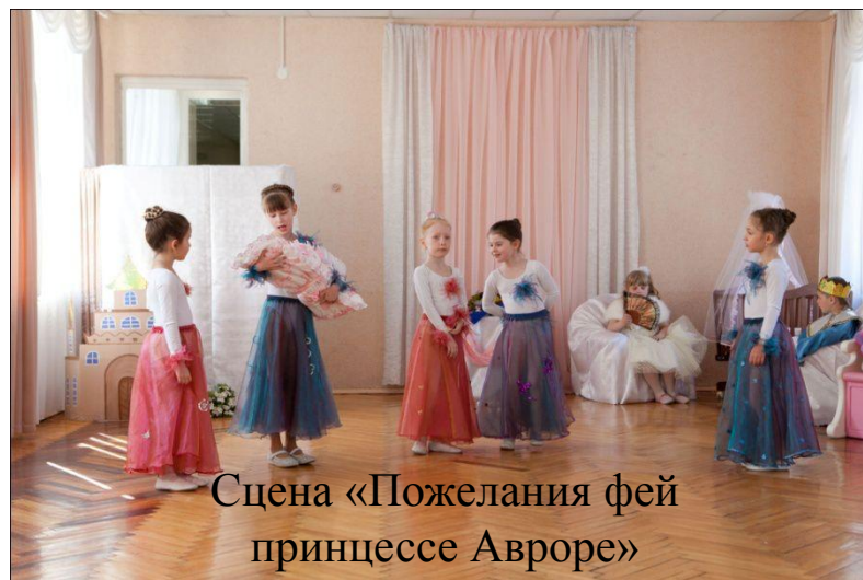
Сцена «Пожелания фей принцессе Авроре»