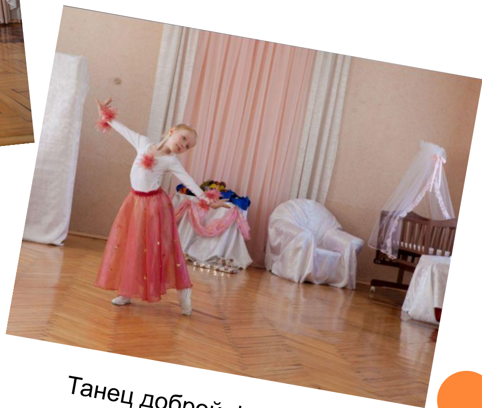
Танец доброй феи