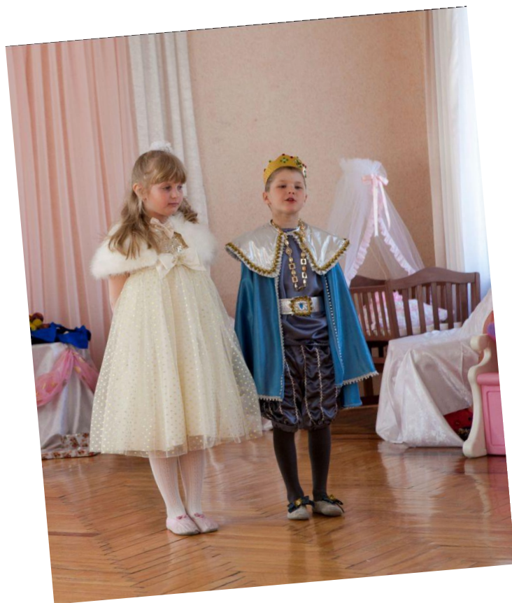
Песня «В гостях у сказки»