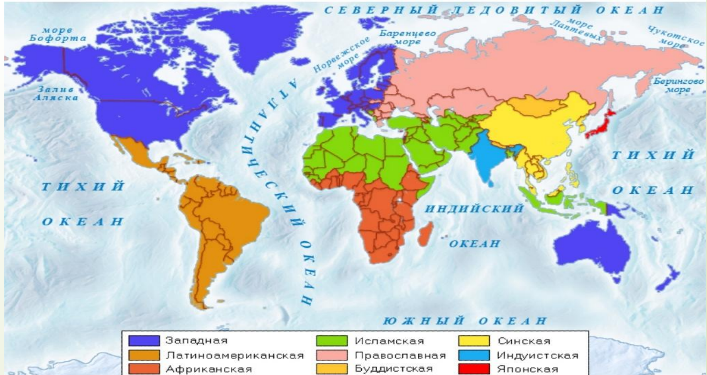
Культурные миры - цивилизации (по С. Хантингтону).