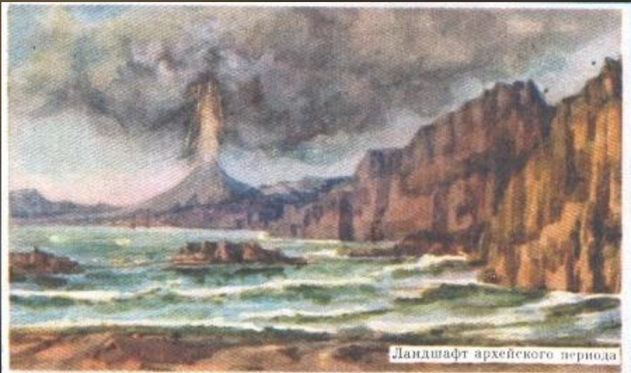
Ландшафт архейского периода

Архейский эон, или архей, охватывает период от 3900 до 2600 млн. лет тому назад. К этому времени относится возникновение древнейших осадочных пород, часть которых сохранилась в районах Лимпопо (Африка), Исуа (Гренландия), Варавуна (Австралия), Алдана (Азия). Эти породы содержат либо биогенный углерод, связанный в своем происхождении с жизнедеятельностью организмов, либо строматолиты и микрофоссилии. Строматолиты - кораллоподобные осадочные образования (карбонатные, реже кремниевые), представляющие собой продукты жизнедеятельности древнейших автотрофов. В протерозое они всегда связаны с цианобактериями, но их происхождение в архее не вполне ясно. Микрофоссилии - микроскопические включения в осадочные породы ископаемых микроорганизмов. В архее все организмы относятся к прокариотам.