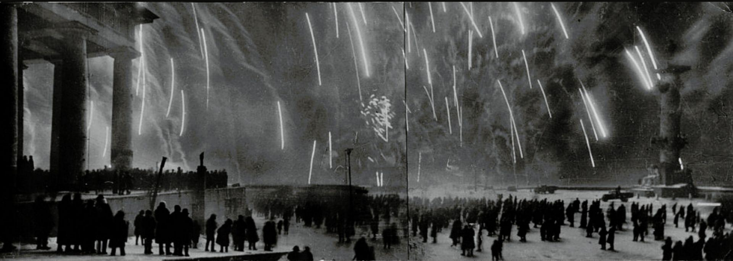
Снятие блокады Ленинграда 27 января 1944 год