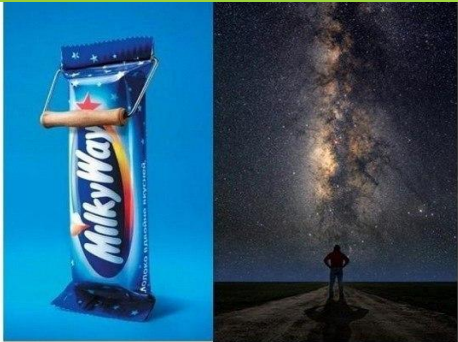
Milky way - млечный (молочный) путь