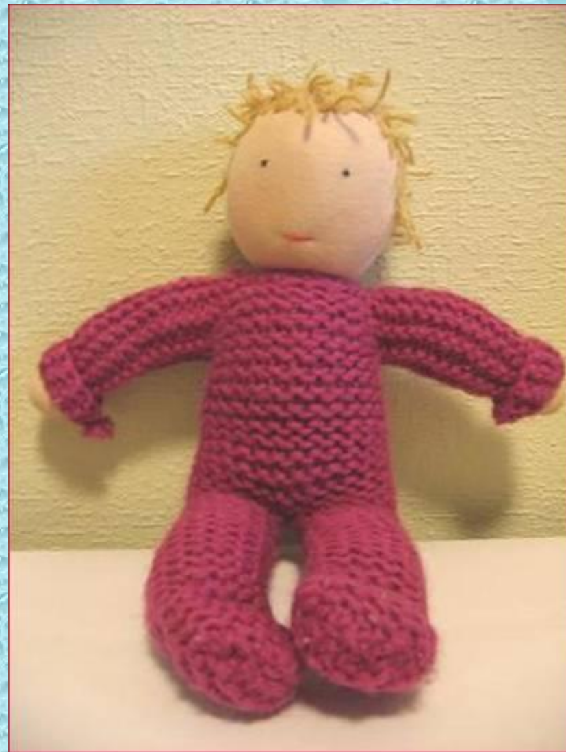
Кукла Том, рост 30 см