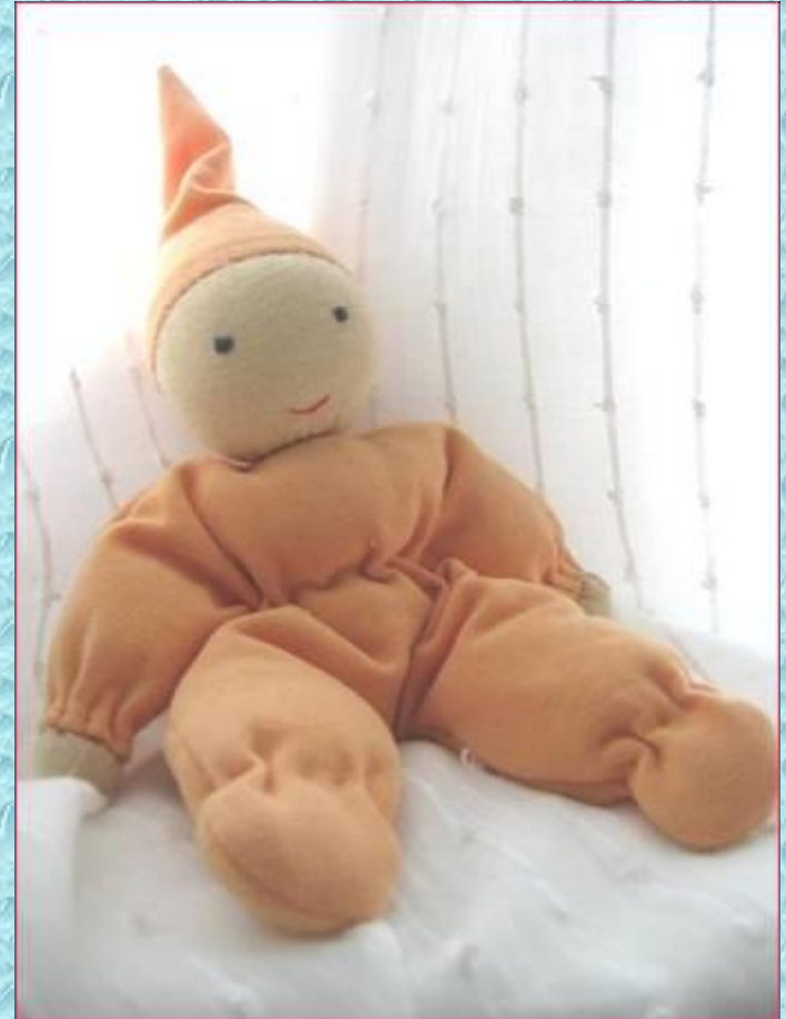
Гномик. Рост 20 см, в попе, ручках и ножках - пшено