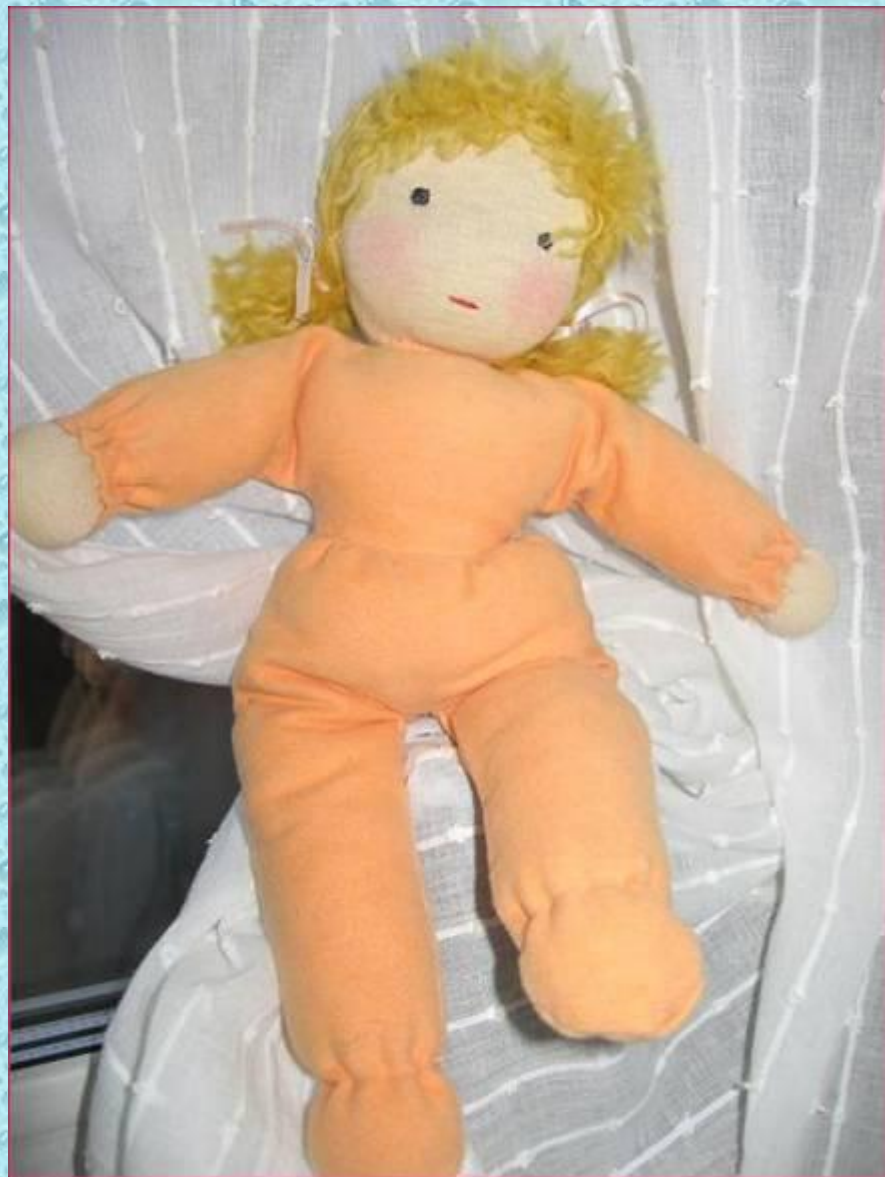
Куклы Катя и Ксюша в пришивной одежде. Рост 30 см