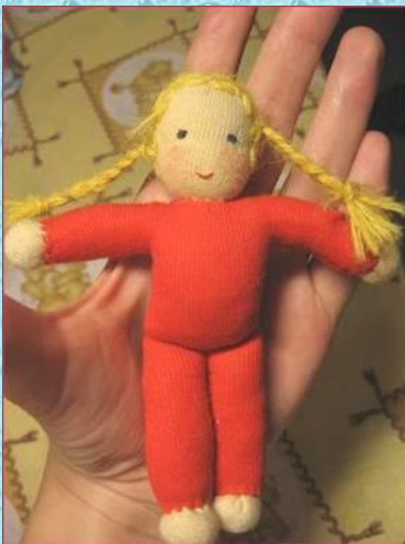
Мини-куколка Маша. Рост 10 см