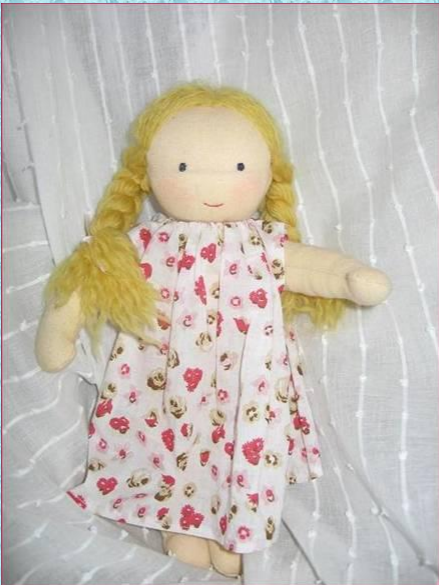
Вальдорфская кукла Света