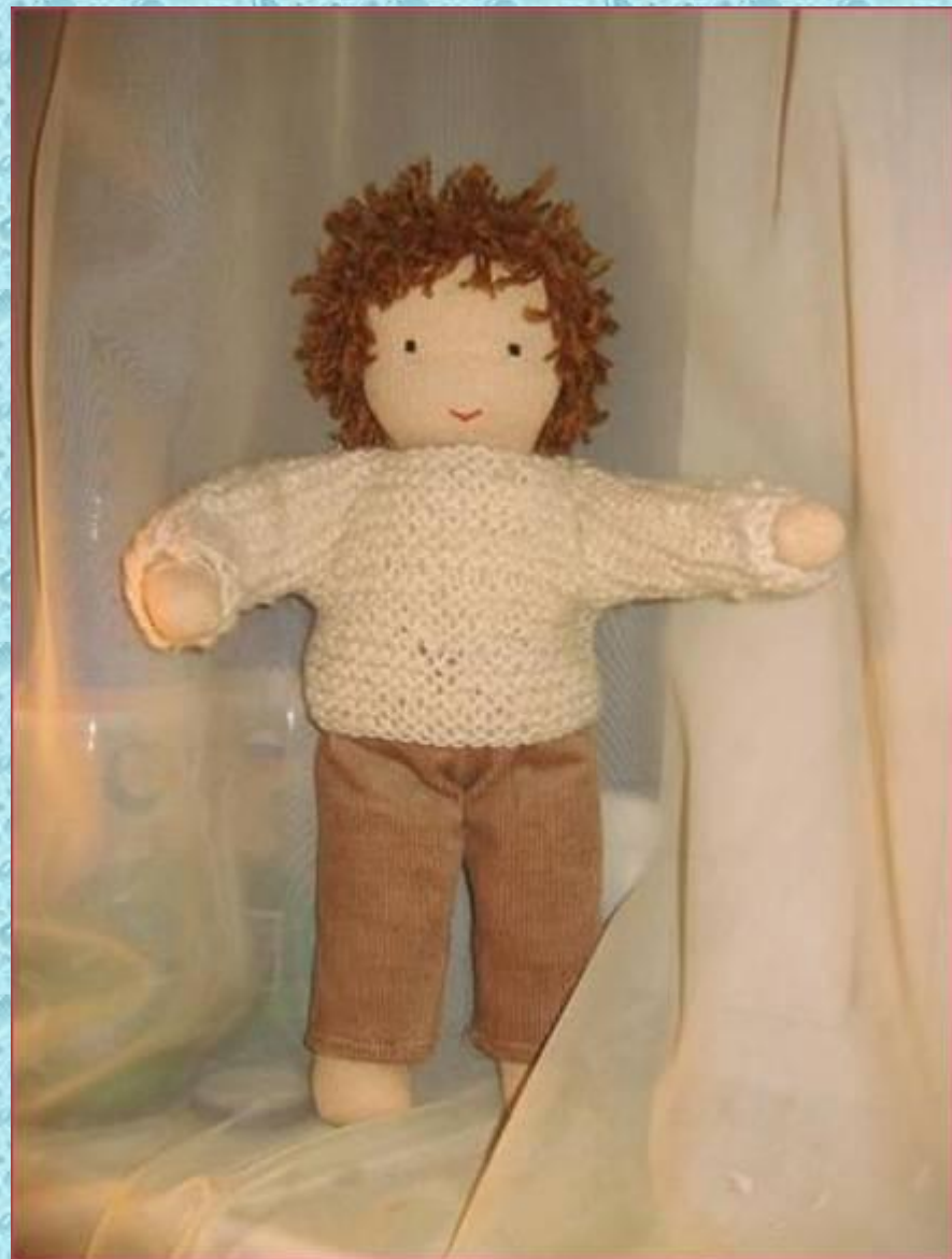
Федя, друг Светы. Рост 30 см