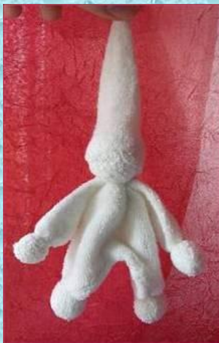
Махровый гномик для самых маленьких