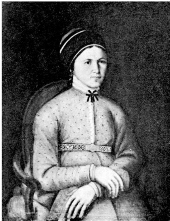
Портрет казачки в зеленом кубелеке, 19 в.