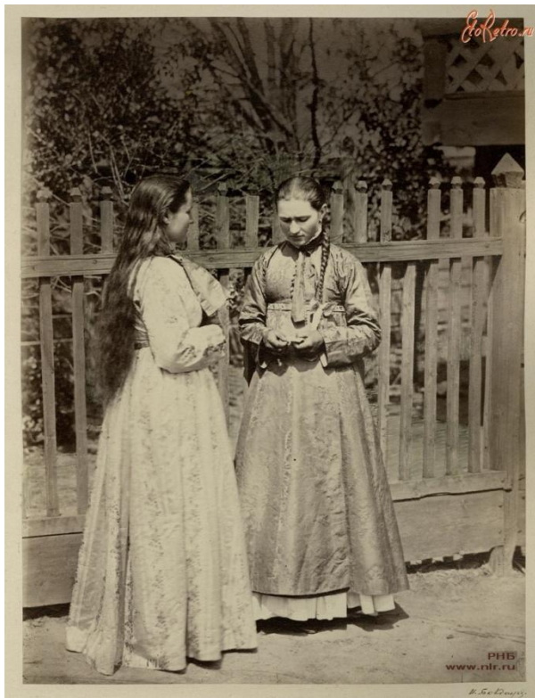
□ Девичий кубелек