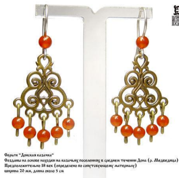
Серьги "Донская казачка" Созданы на основе находки на казачьих поселениях в среднем течении Дона (р. Медведица) Предположительно 18 век (определено по сопутствующему материалу) ширина 20 мм, длина около 5 см