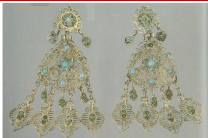
Татарские серьги «Алкалар» 19 в.