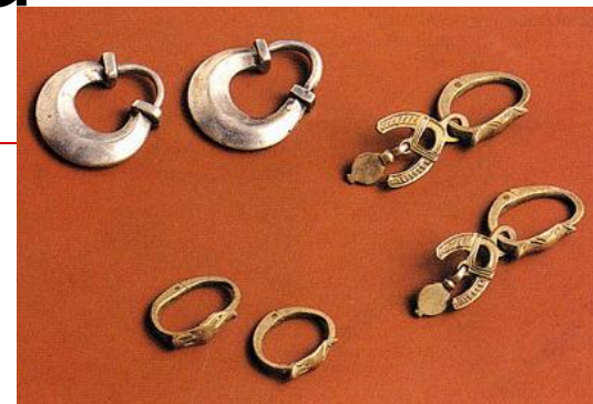
Мужская казачья серьга