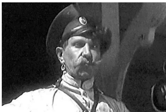
Кадр из к/ф «Тихий Дон»