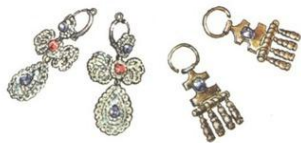
Традиционные женские ювелирные украшения.