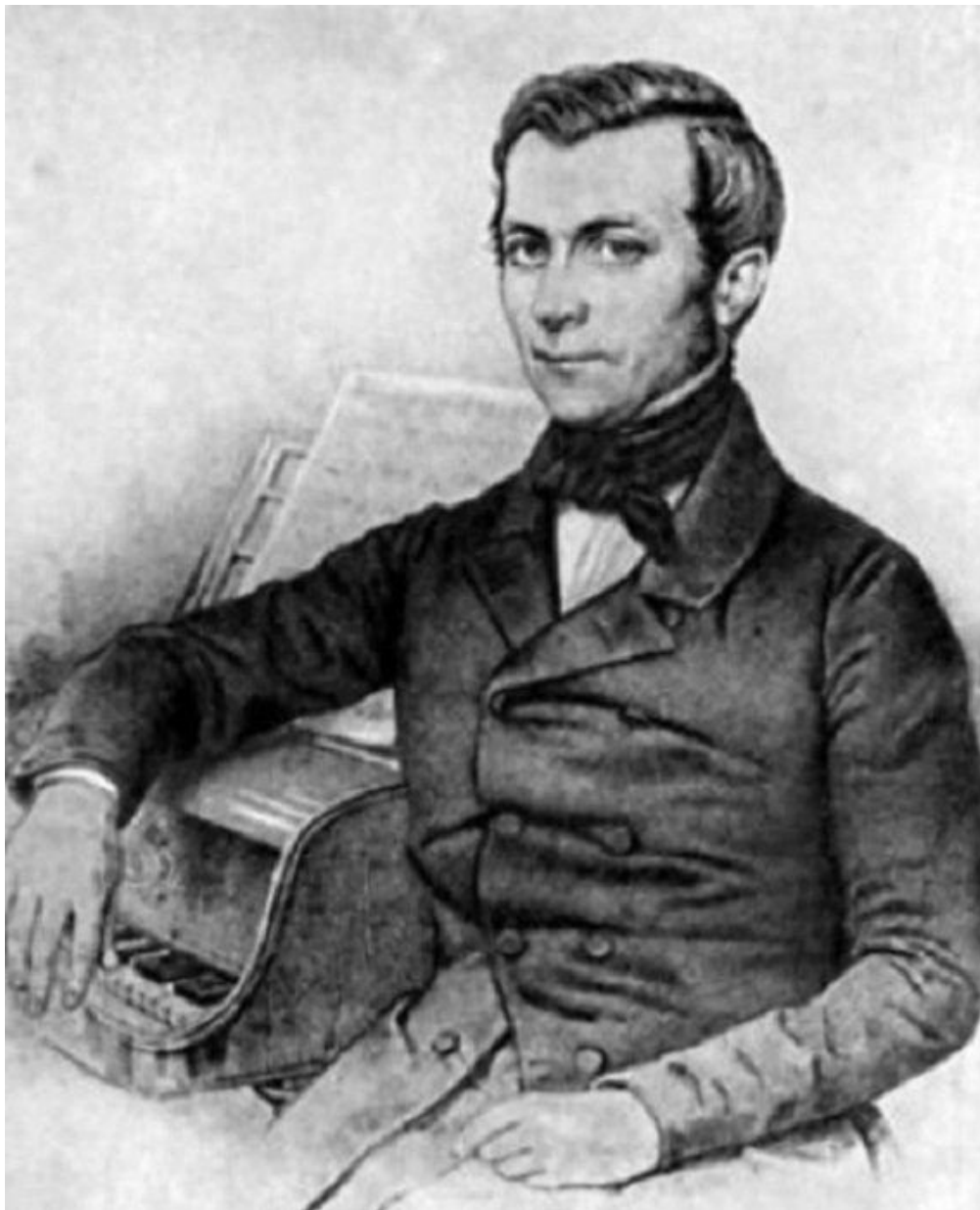
Александр Львович Гурилев (1803-1858)