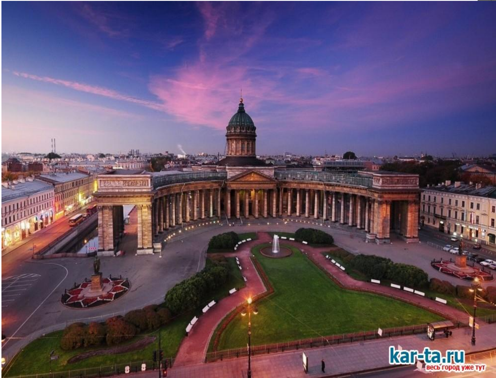
Воронихин - Казанский собор