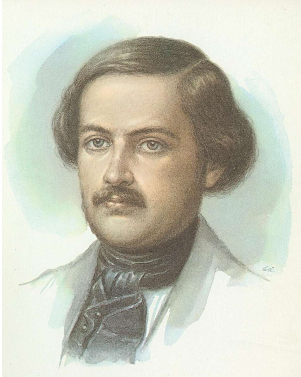
Александр Егорович Варламов (1801-1848)