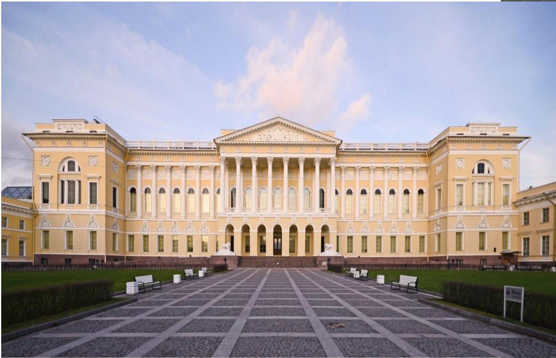
Росси - Михайловский дворец