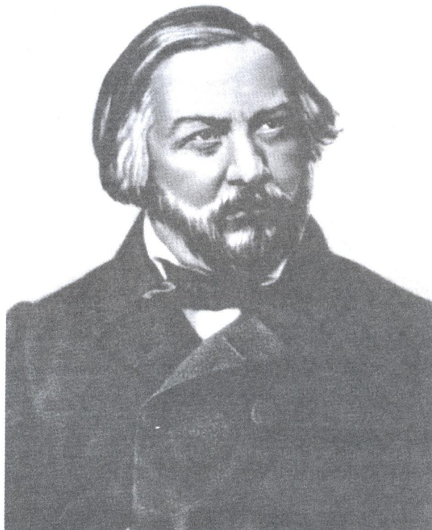
Михаил Иванович Глинка