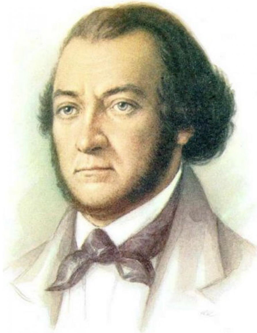
Александр Александрович Алябьев (1787-1851)