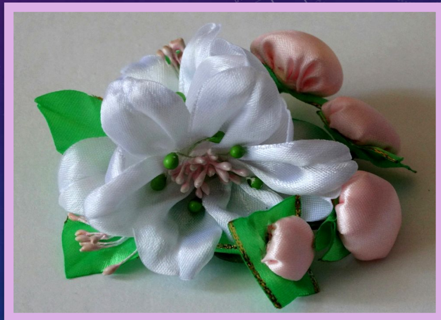
Заколка для волос