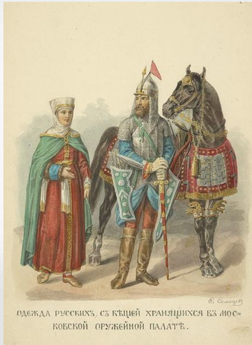
ОДЕЖДА РУССКИХЪ, СЪ КЪЩЕЙ ХРАНЯЩИХСЯ ВЪ МОСКОВСКОЙ ОРУЖЕЙНОЙ ПАЛАТѢ.

В 1571 Воротынский М.И. составил первый военный устав, посвящённый организации сторожевой и станичной службы.