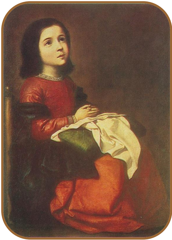
Франсиско Сурбаран Отрочество Мадонны

Иоаким и Анна, исполнив свой обет, возвратились домой, а Мария осталась жить при храме. Там она вместе с другими девочками обучалась Закону Божию и рукоделию; много молилась, читала Священное Писание и строго