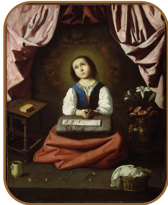
Франсиско Сурбаран Детство Марии

Иоаким и Анна, исполнив свой обет, возвратились домой, а Мария осталась жить при храме. Там она вместе с другими девочками обучалась Закону Божию и рукоделию; много молилась, читала Священное Писание и строго