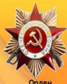
Орден Отечественной Войны 1 степени