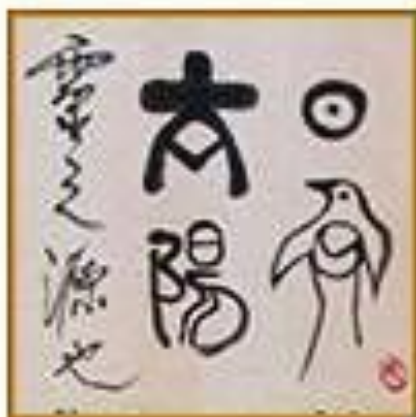
ЯПОНИЯ И КИТАЙ