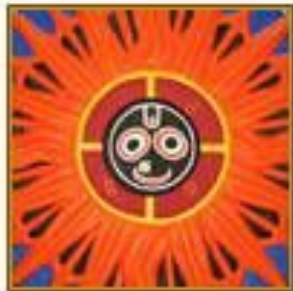
ЮГО-ВОСТОЧНАЯ АЗИЯ И ОКЕАНИЯ