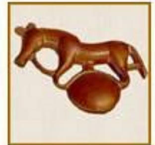
СИБИРЬ И АЛТАЙ