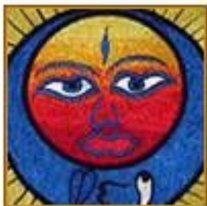
ИНДИЯ И НЕПАЛ