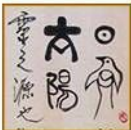
ЯПОНИЯ И КИТАЙ