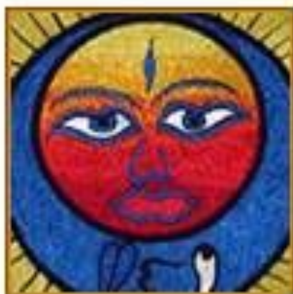
ИНДИЯ И НЕПАЛ