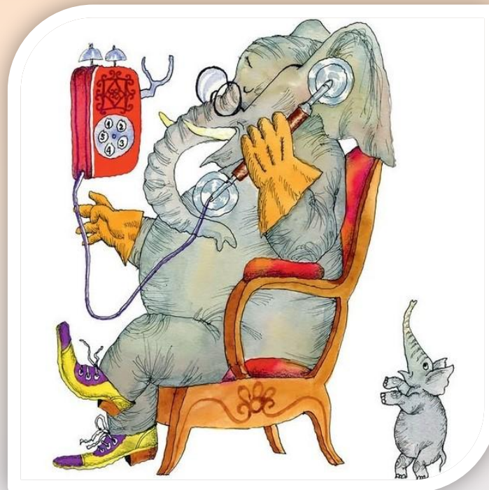
«Телефон» К. Чуковский