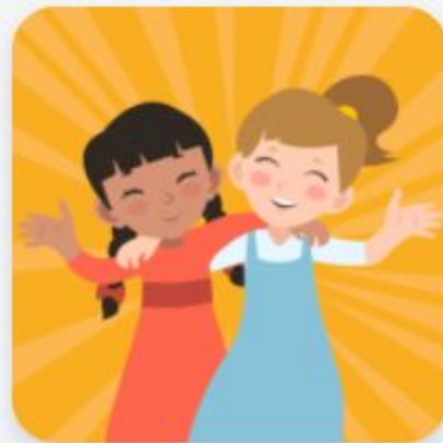
Связь народов России