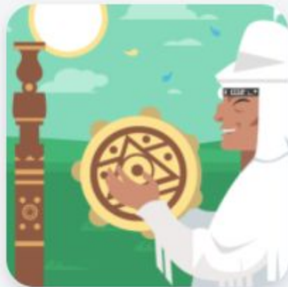
Праздники и религии народов России