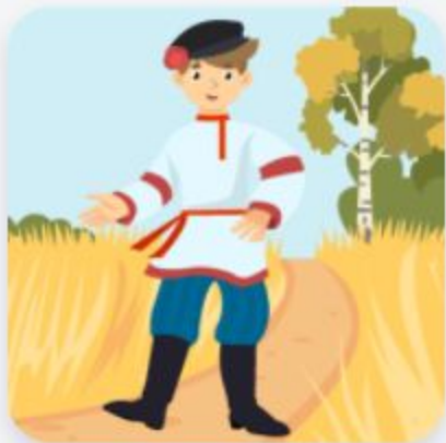
Костюмы народов России