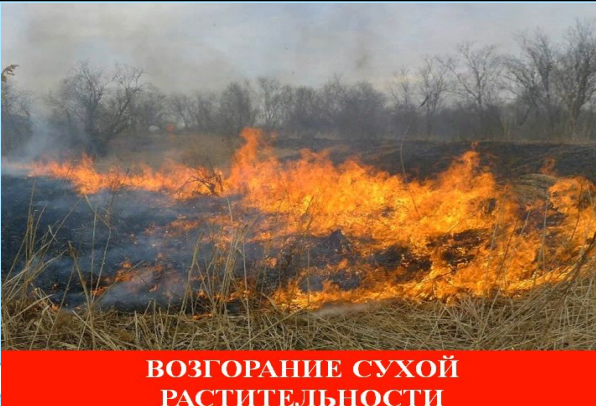
ВОЗГОРАНИЕ СУХОЙ РАСТИТЕЛЬНОСТИ

Прогнозируемые риски. Чрезвычайная пожароопасность (5 класс)