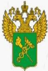
Федеральная таможенная служба