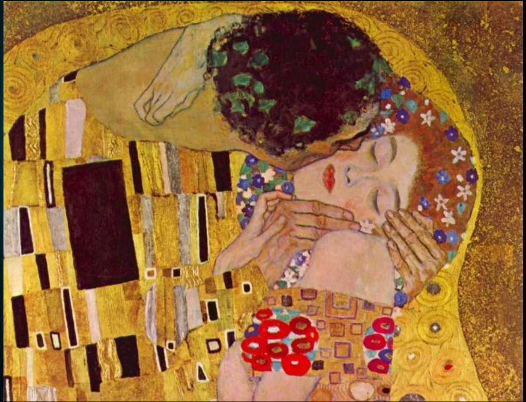
Густав Климт "Поцелуй". 1908 -1909 (Адрес: ул. Вокзальная, 10, Автовокзал)