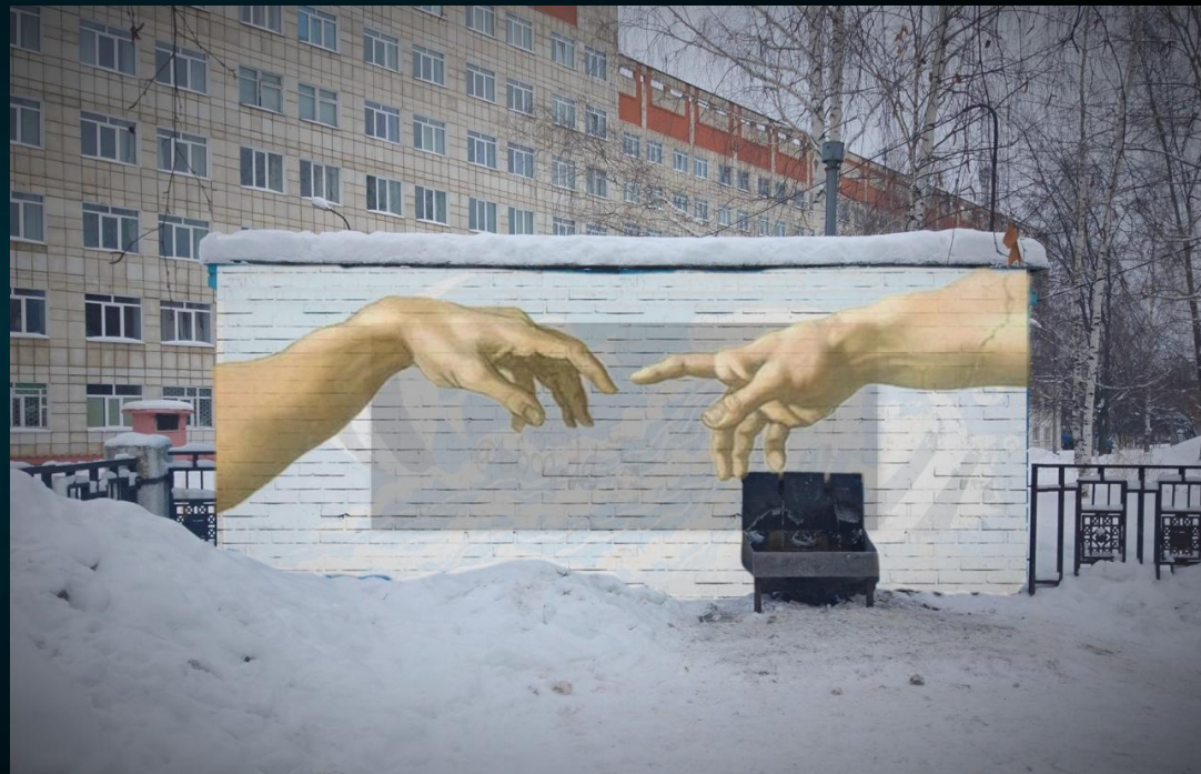
Микеланджело Буонарроти "Сотворение Адама" 1508-1512 (элемент) (улица Горького, Родник на территории ГБУЗ ПК "Чайковская ЦГБ").