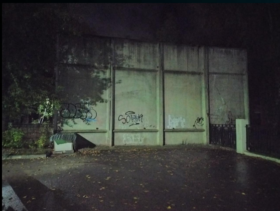
Ян Вермеер "Девушка с жемчужной сережкой" 1665 г (Здание гаража ГБУЗ ПК "Чайковская ЦГБ" на улице Горького) . . . .