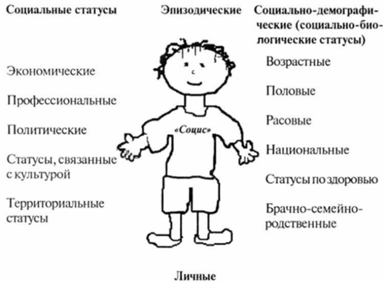
Рис. 4.2. Статусный портрет индивида