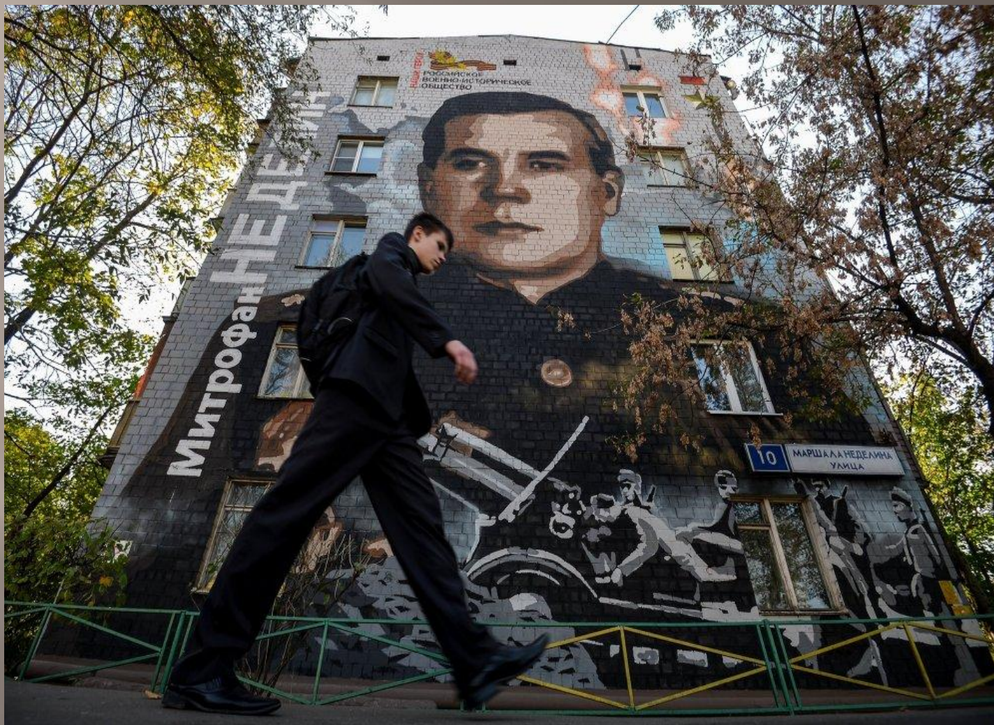
Улица Маршала Неделина, дом 10