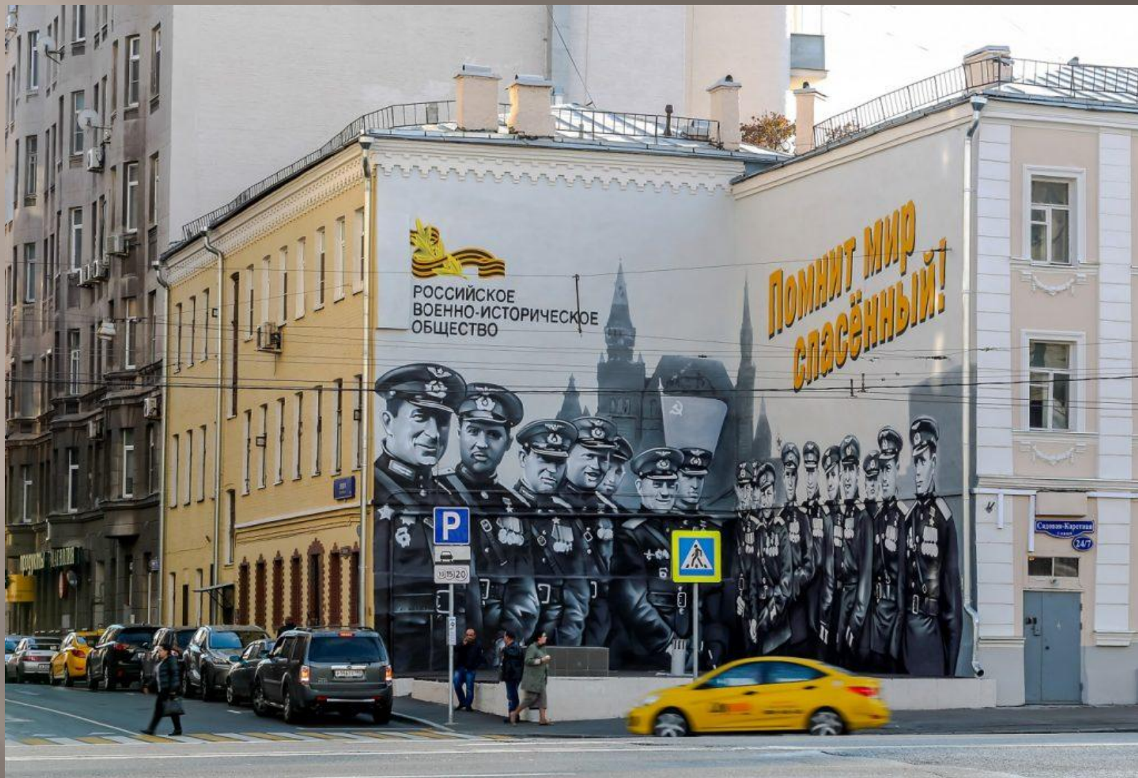
Улица Садово-Каретная, дом 24/7