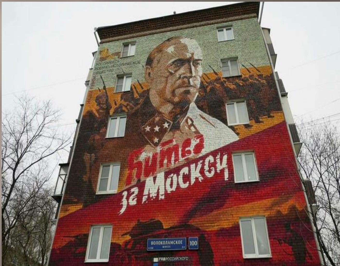
Волоколамское шоссе, дом 100.