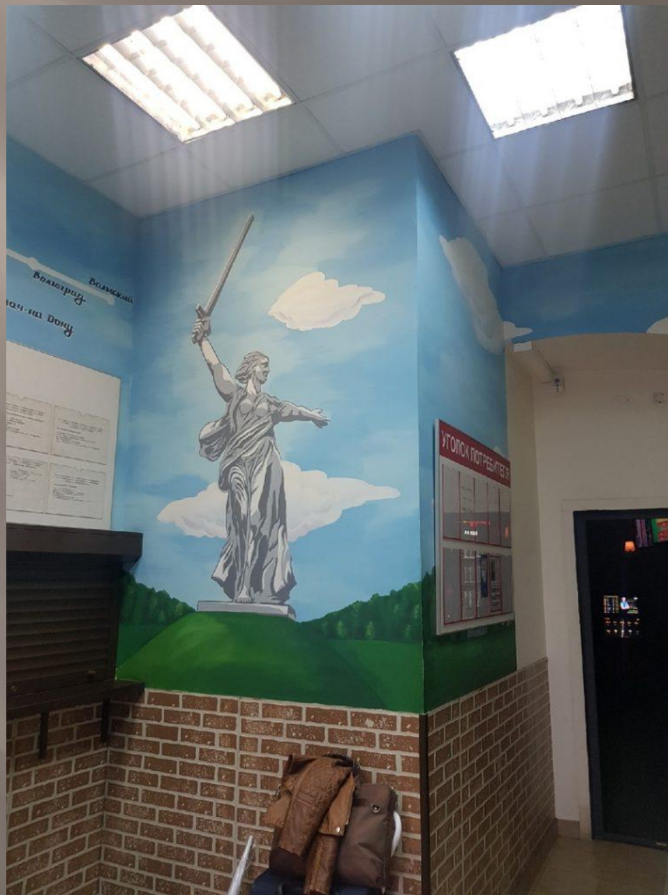
Автовокзал, метро «Павелецкая»