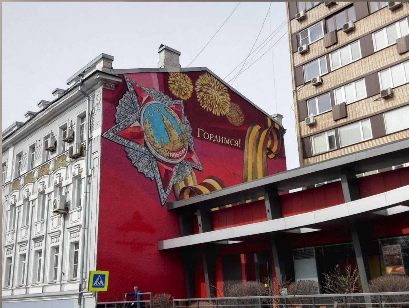
Улица Большая Бронная, дом 27/4, строение 1