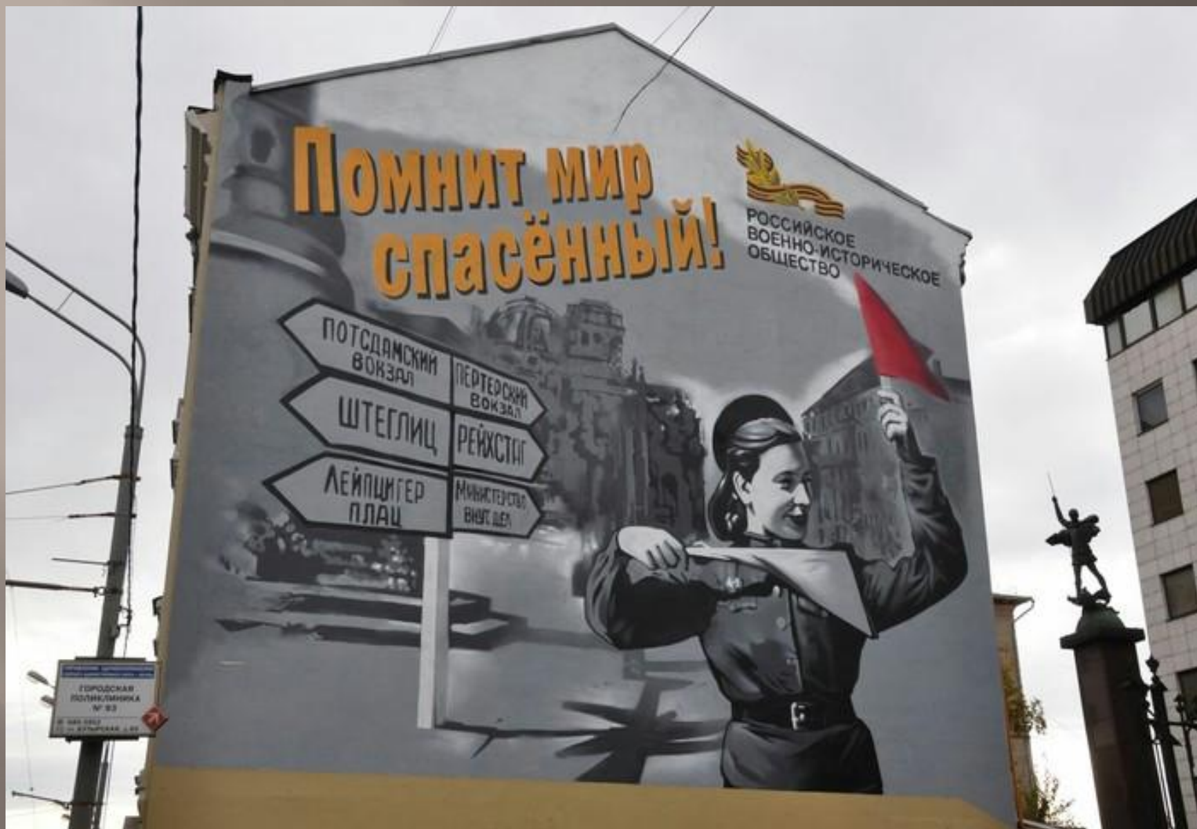
Улица Бутырская, дом 67