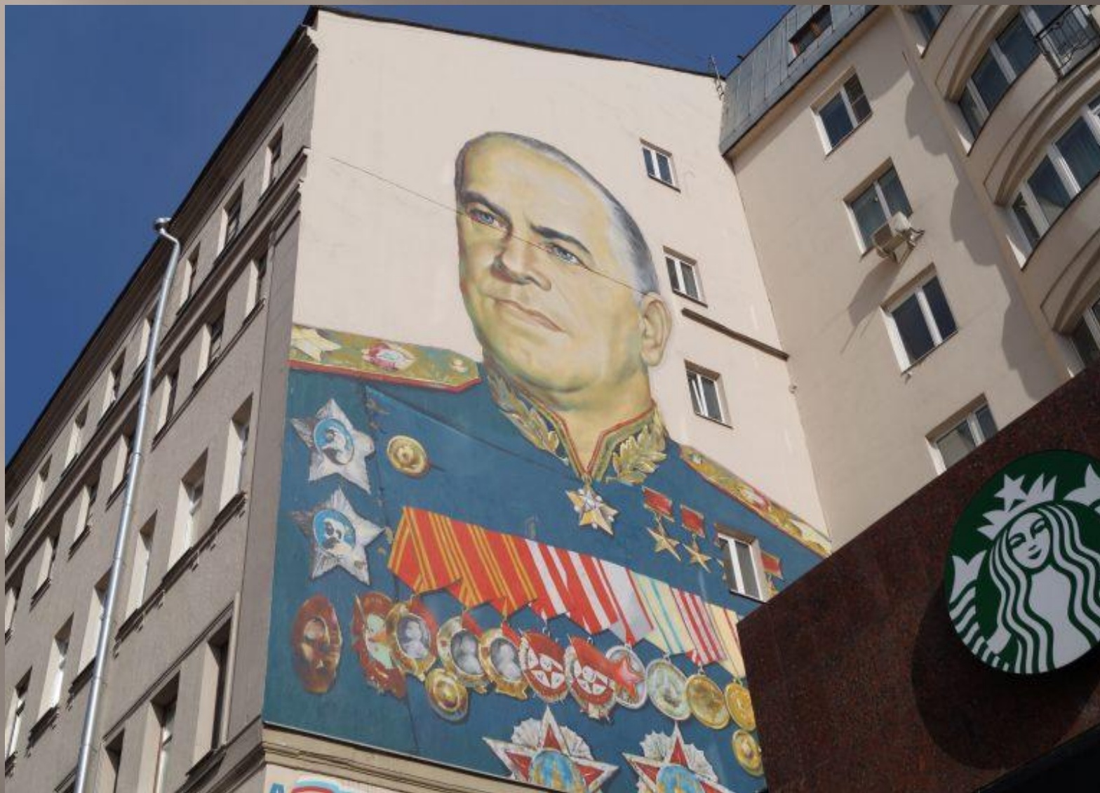
Улица Старый Арбат, дом 17.