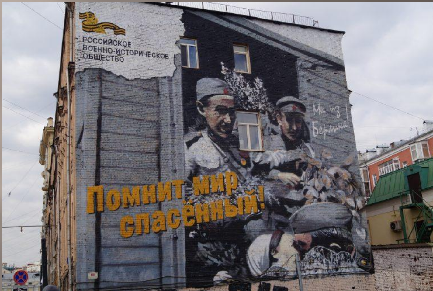
Улица Казакова, дом 3, корпус 1.