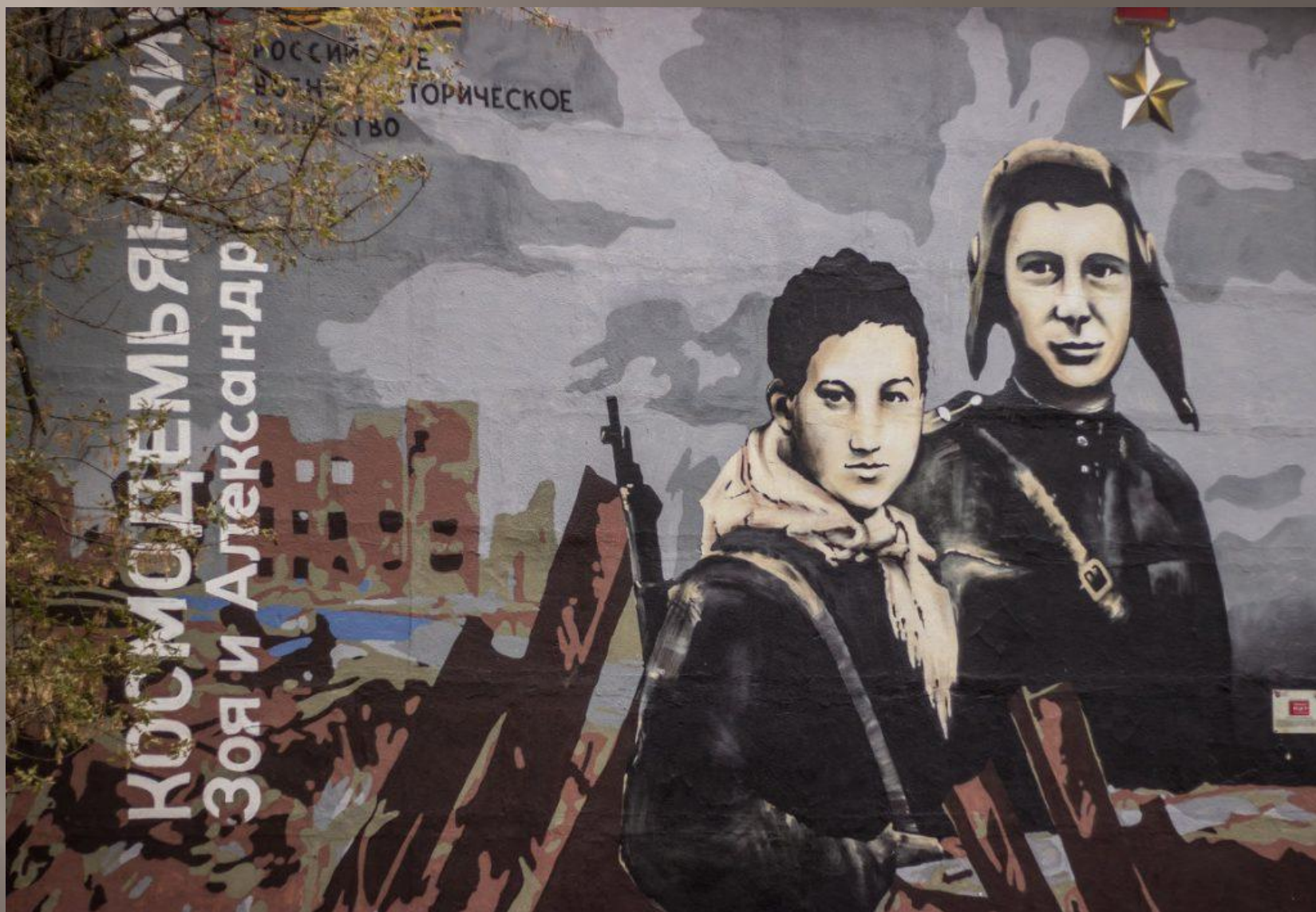
Улица Космодемьянских, дом 34