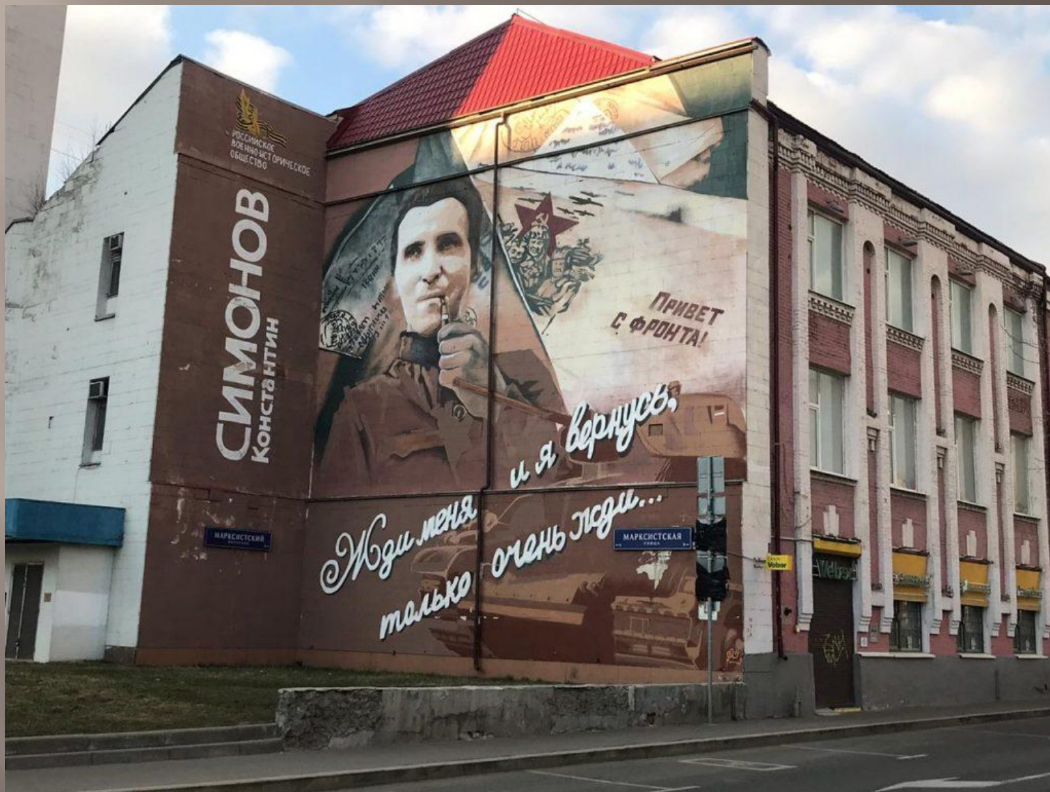
Улица Марксистская, дом 3