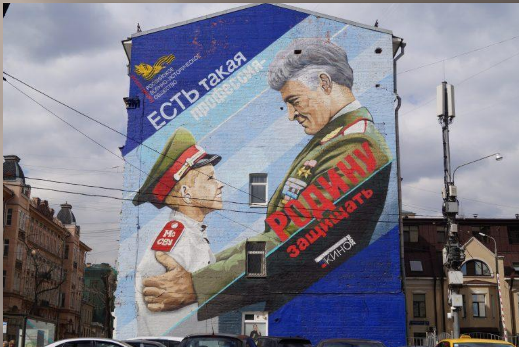
Улица Новая Басманная, дом 35, строение 1