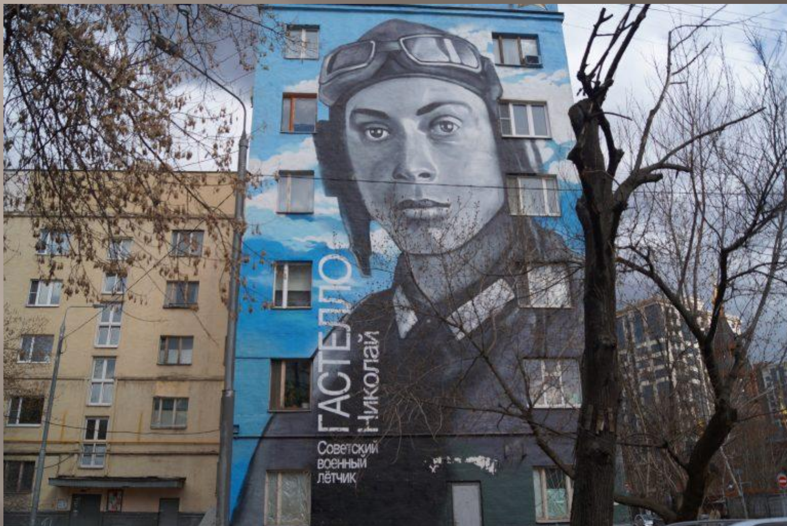
Улица 4-я Сокольническая, дом 2.