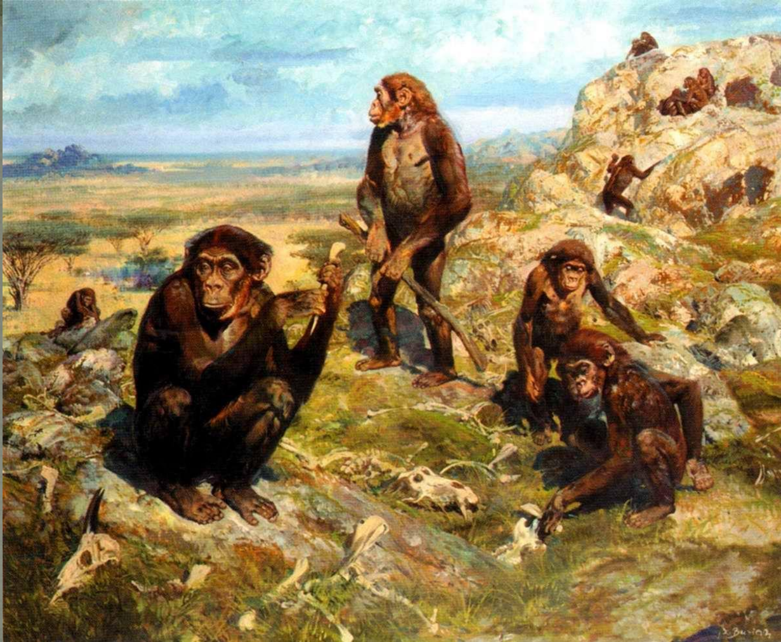
Праобщина «людей умелых»