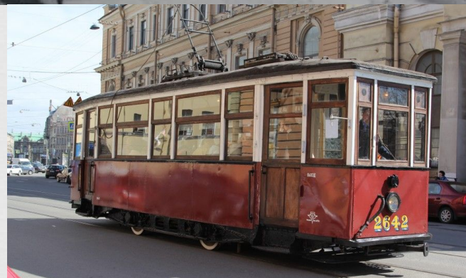
Воздушный нападением фугасной бомбы трамвай на Владимирской площади