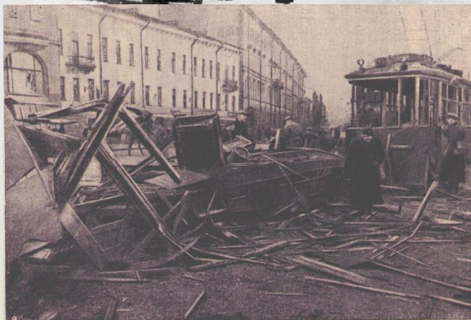
Разрушенный подвалом фугасной бомбы трамвай на Владимирской площади