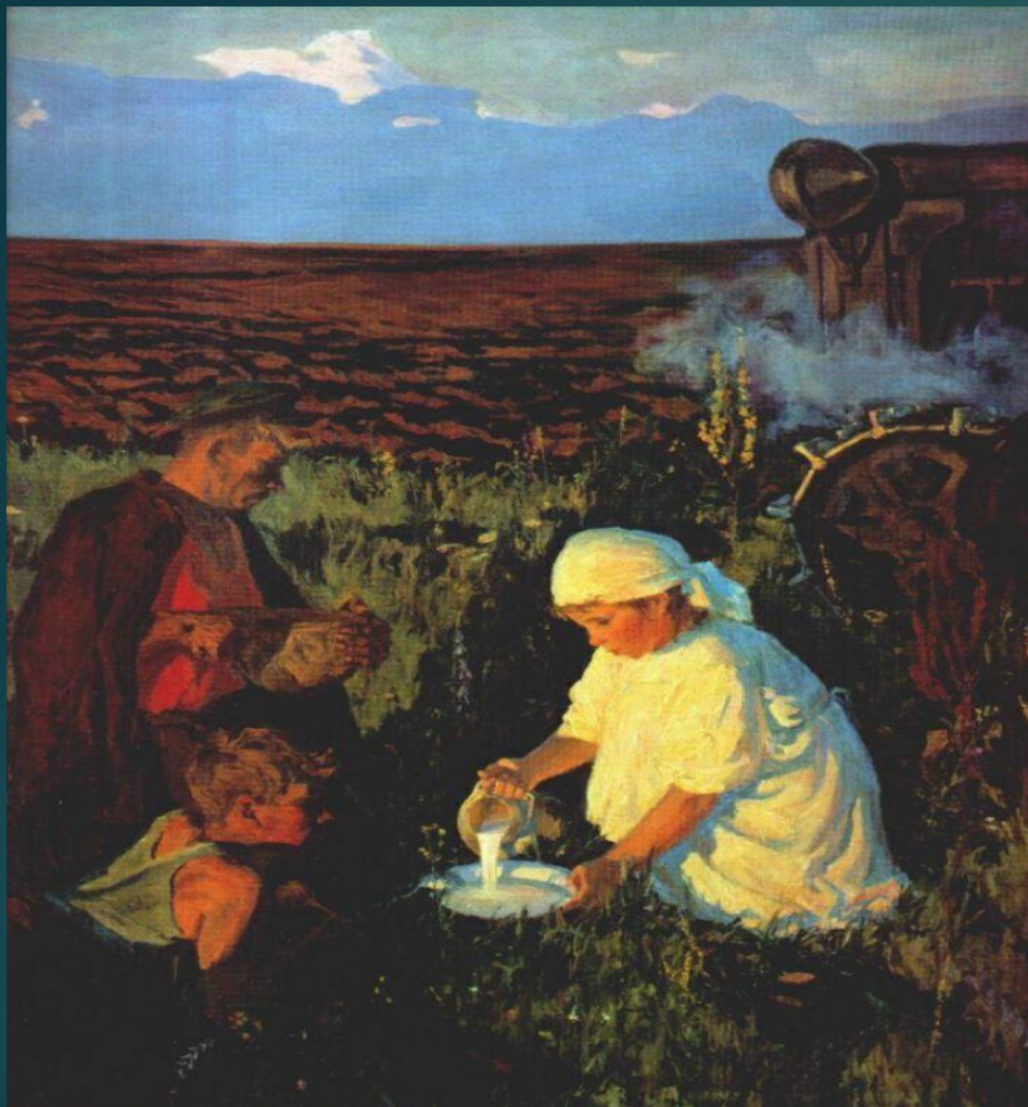
А.Пластов «Ужин тракториста»