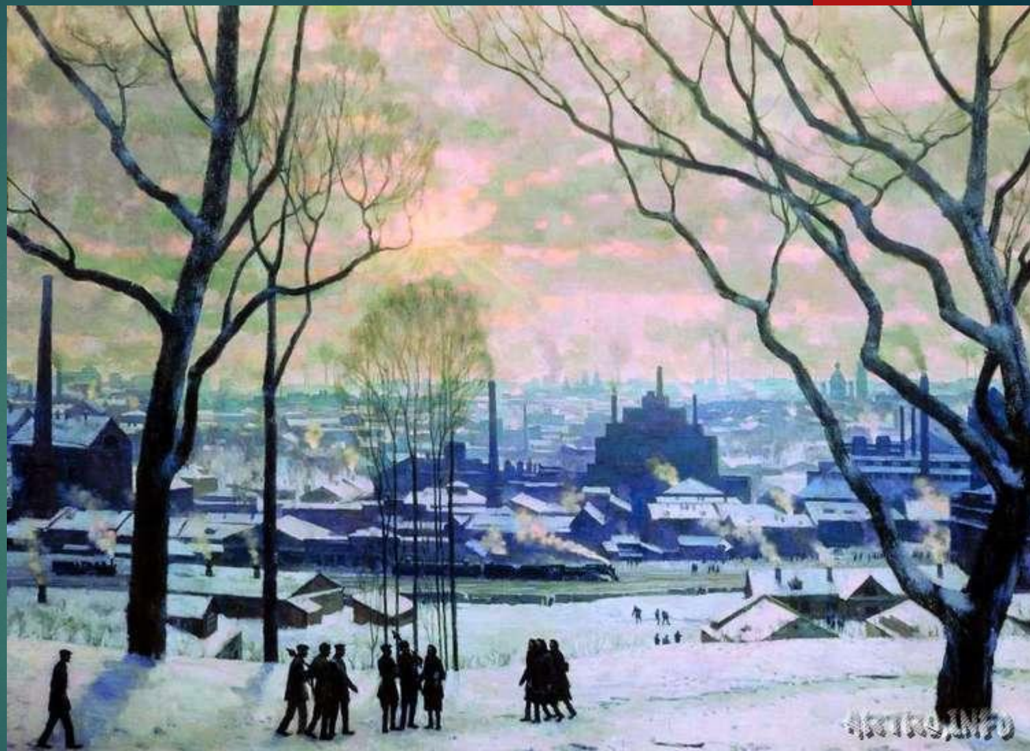
К.Юон «Утро индустриальной Москвы»