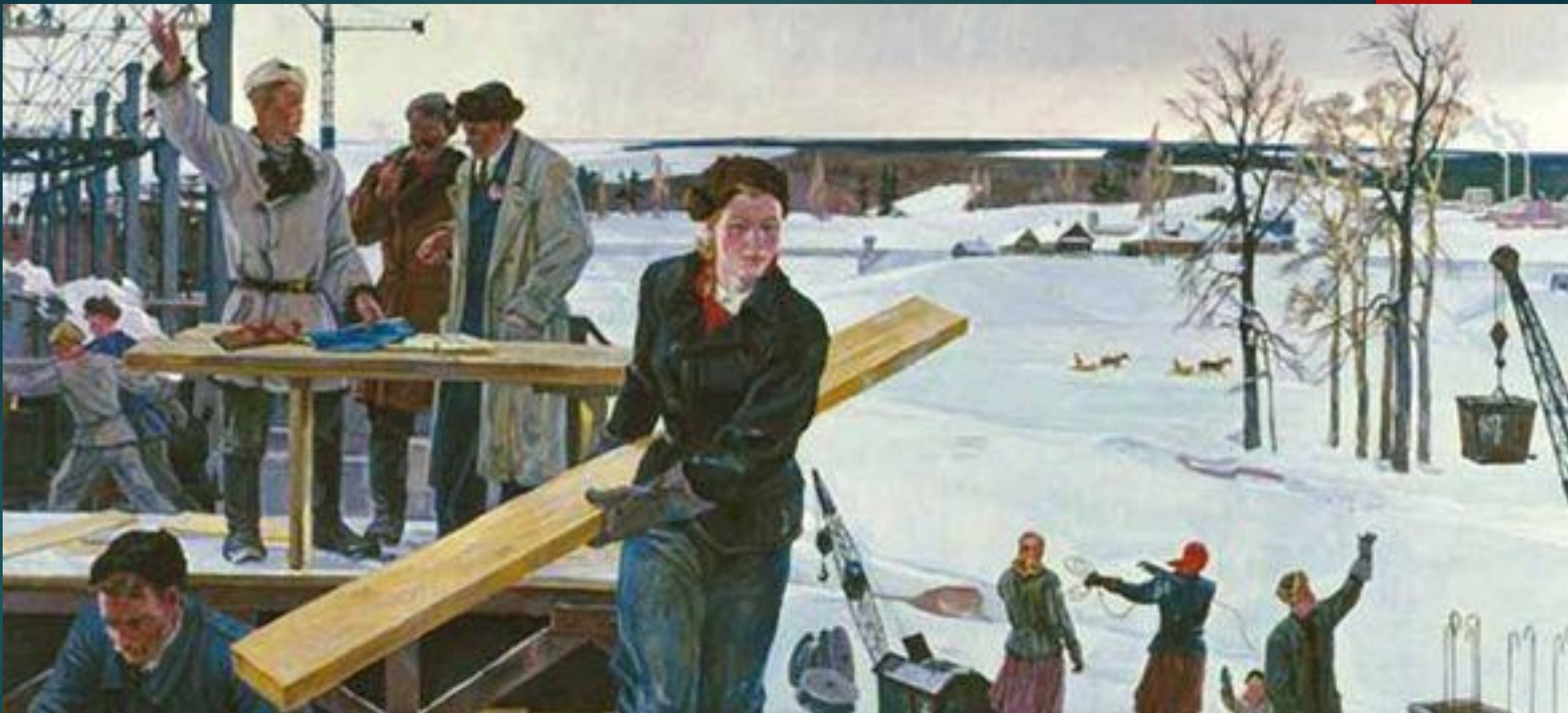
А.Дейнека «На просторах подмосковных строек»