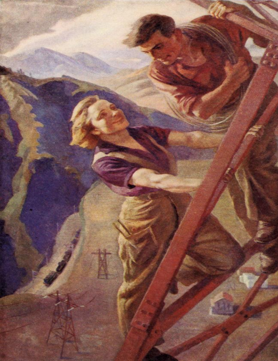
С.Ренгина «Всё выше»