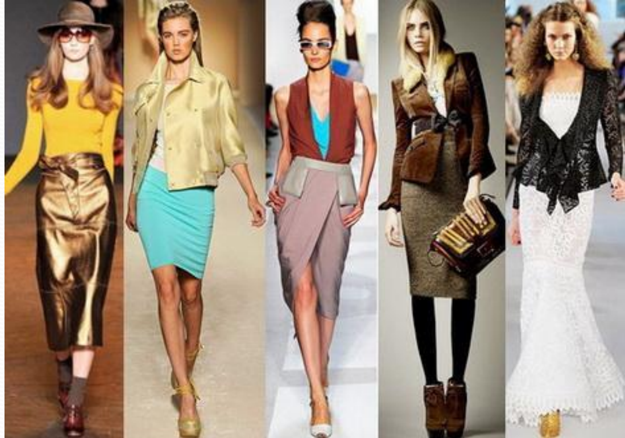
модели современных юбок