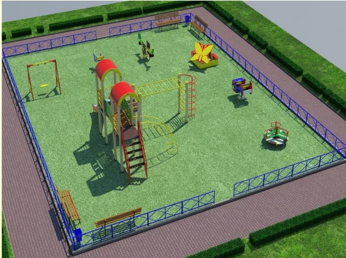
Общий вид детской площадки