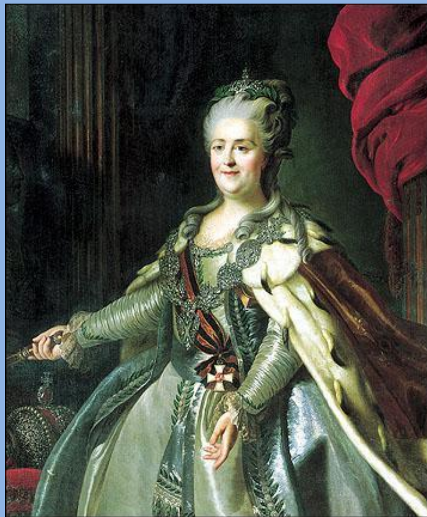
Екатерина II с орденом Святого Георгия 1-й степени.

В 1769 году императрица Екатерина Вторая учредила высшую награду империи - Императорский Военный орден Святого Великомученика и Победоносца Георгия.