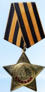
Орден Славы I степени