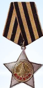
Орден Славы II степени