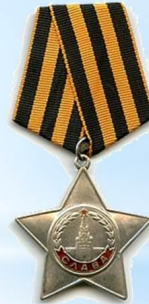
Орден Славы III степени