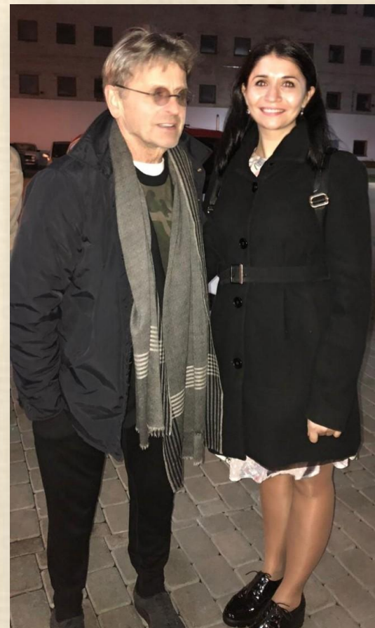
*На фото: Михаил Барышников