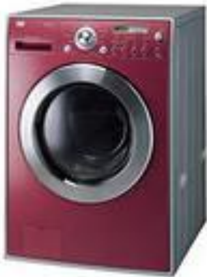
Рисунок стиральной машины барабанного типа