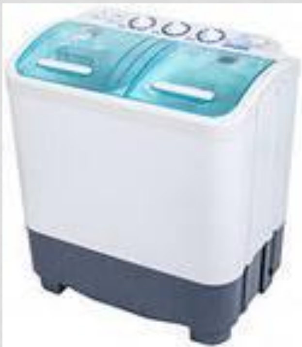
Рисунок стиральной машины активаторного типа