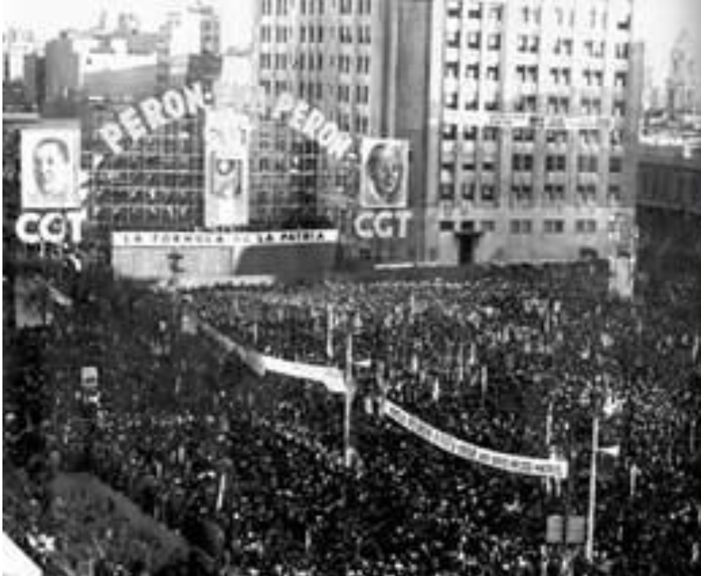
1973- 1974 гг. Митинг в Буэнос-Айресе в поддержку Евы и Хуана Перон.