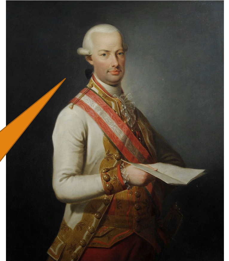
Леопольд II (1790-1792, брат Иосифа

«У меня есть сестра, королева Франции (Мария-Антуанетта), но у Священной империи нет сестры и нет её у Австрии. Мне позволительно действовать, как того требует благо народов, а не фамильные интересы».