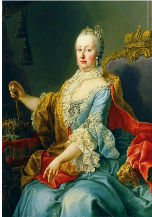
Императрица Мария Терезия (1740-1780)

Цель – создать централизованное государство с единообразными законами, администрацией, судом.