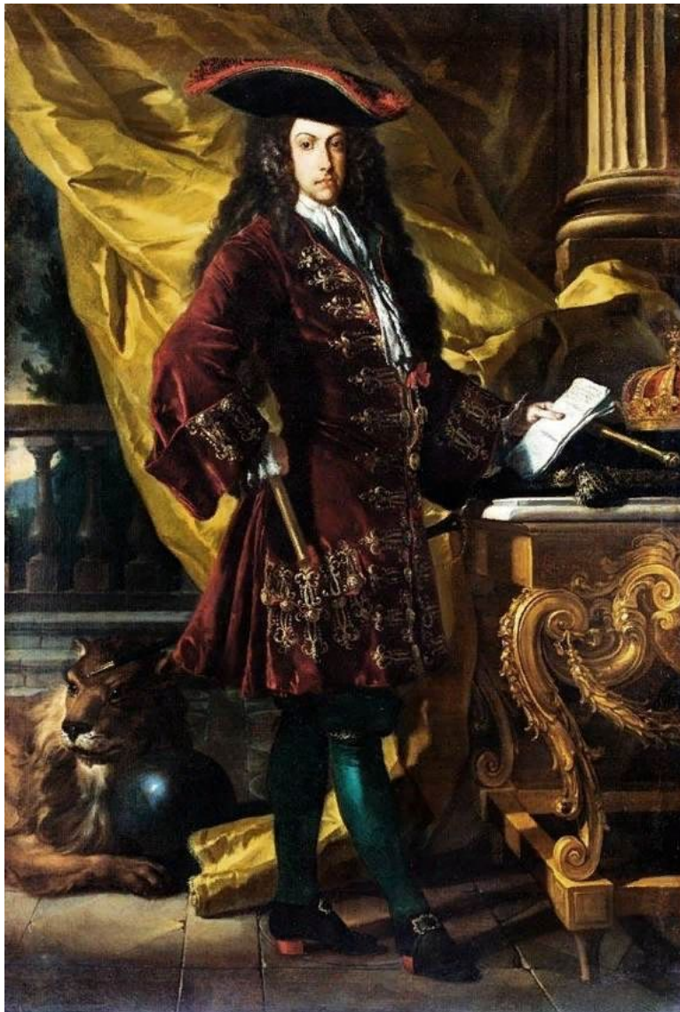
«Карл VI». Ф. Солимена

Династия Габсбургов удерживала земли, населённые разными народами, от распада. Чтобы избежать дробления владений, император Карл VI (1711–1740) издал Прагматическую санкцию — закон о престолонаследии, по которому «наследственные земли дома Габсбургов» являлись нераздельными и переходили по наследству к старшему сыну умершего короля либо, за отсутствием сыновей, к его старшей дочери.