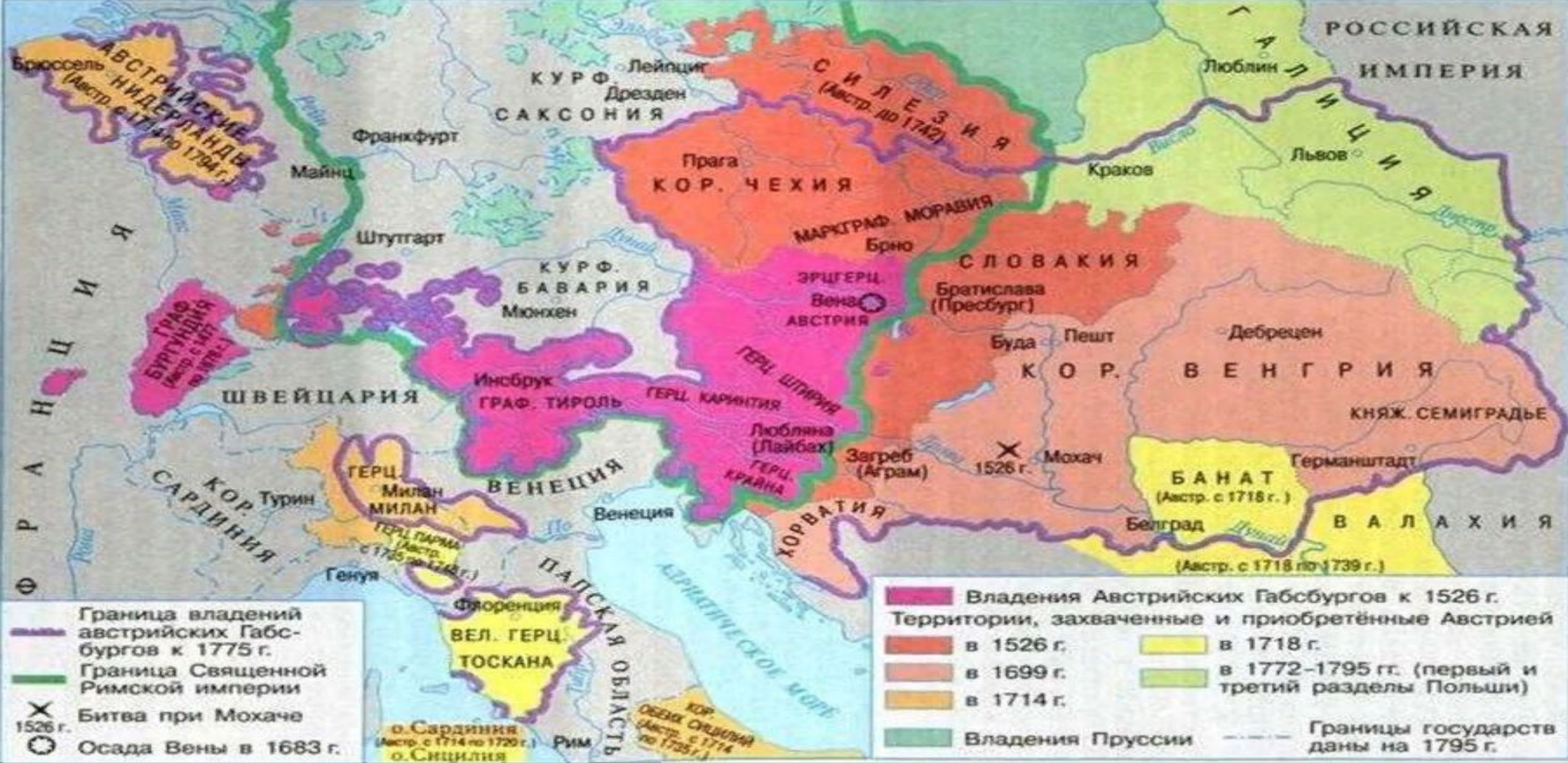
Монархия австрийских Габсбургов в XVI – XVIII вв.