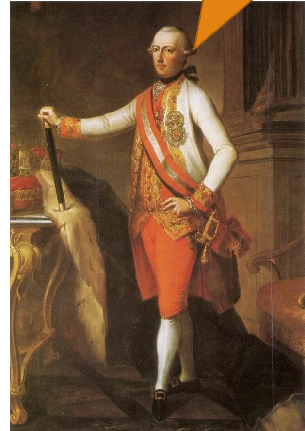
Император Иосиф II