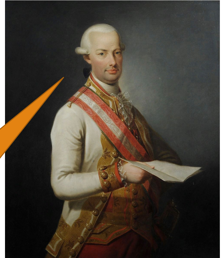
Леопольд II (1790-1792, брат Иосифа

«У меня есть сестра, королева Франции (Мария-Антуанетта), но у Священной империи нет сестры и нет её у Австрии. Мне позволительно действовать, как того требует благо народов, а не фамильные интересы».