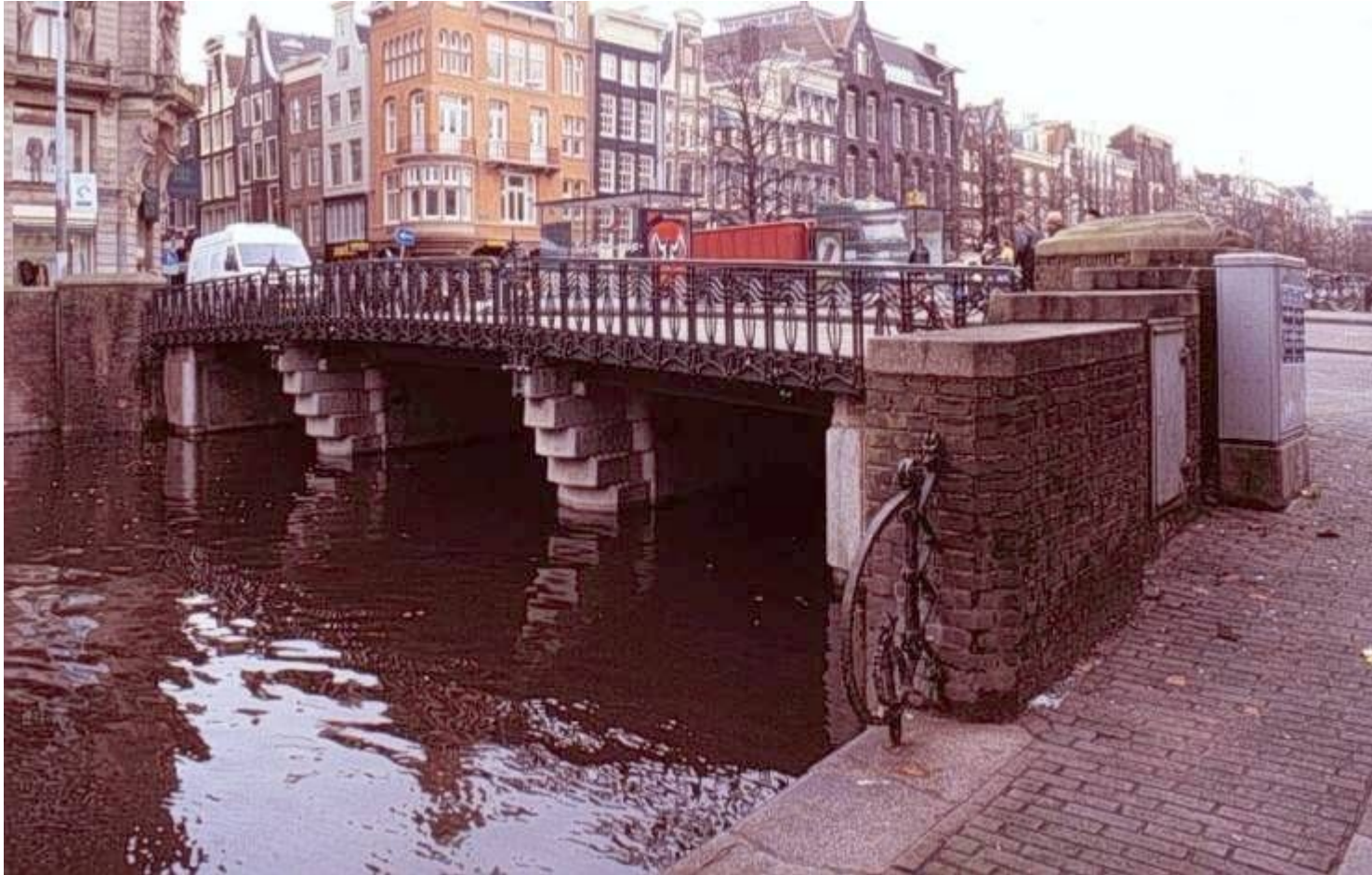
«Брусчатый» мост через Кайзерграхт. Лейдсестрат, Амстердам (П. Крамер, 1921)

Пётр Лодевейк (Пит) Крамер (нидерл. Pieter Lodewijk "Piet" Kramer, 1 июля 1881, Амстердам — 4 февраля 1961, Сантпорт, Велзен) — нидерландский архитектор, один из основоположников архитектурного движения, известного как «Амстердамская школа».