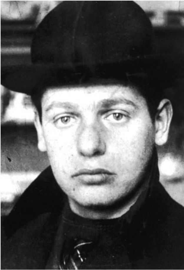
Мишель де Клерк