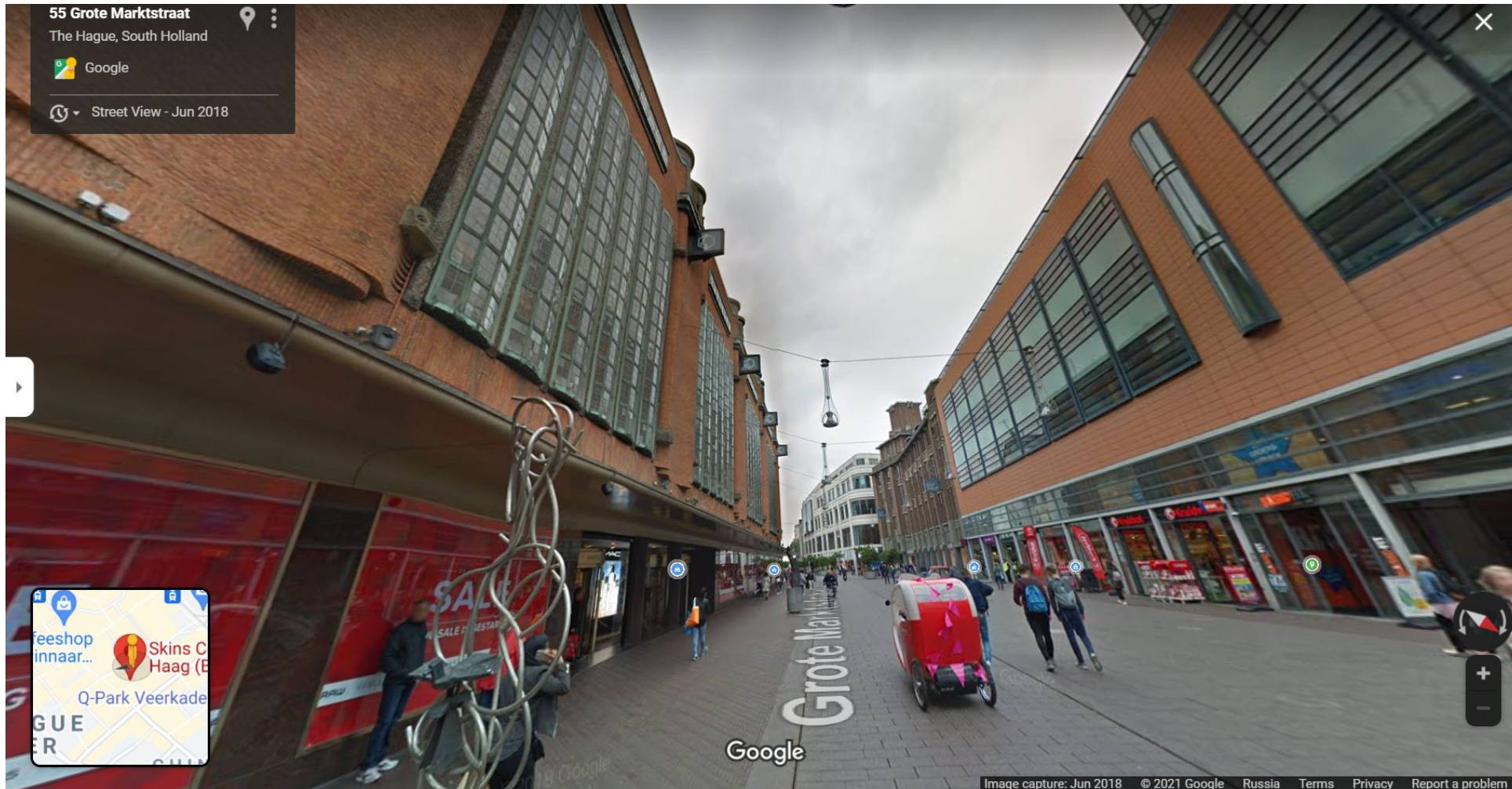
Универсальный магазин «Бейенкорф»

Йо́хан (Ян) Мельхио́р ван дер Мей (нидерл. Johan (Jan) Melchior van der Meij, 19 августа 1878, Дельфсхавен — 6 июня 1949, Гёлле) — нидерландский архитектор, один из основоположников архитектурного движения, известного как «Амстердамская школа».