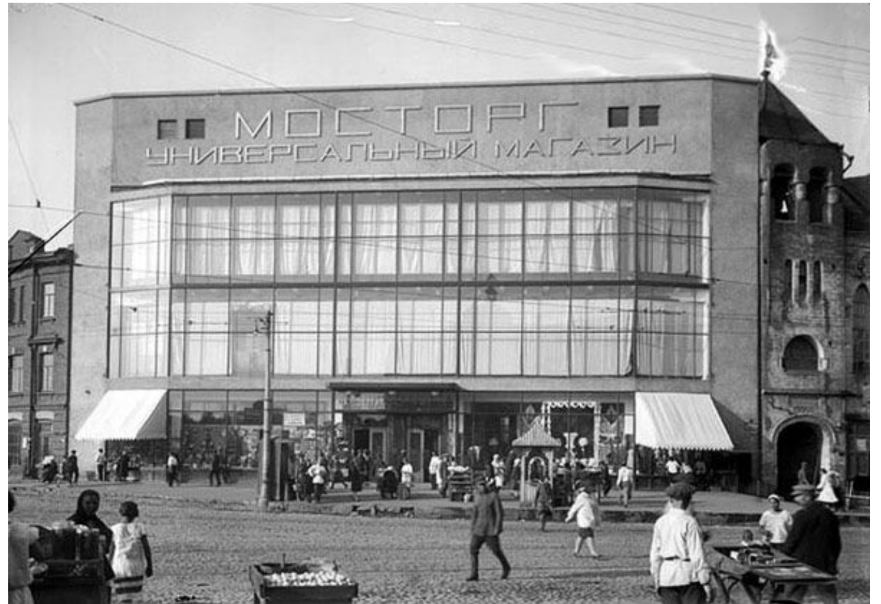
Универсальный магазин Мосторга на Красной Пресне в Москве