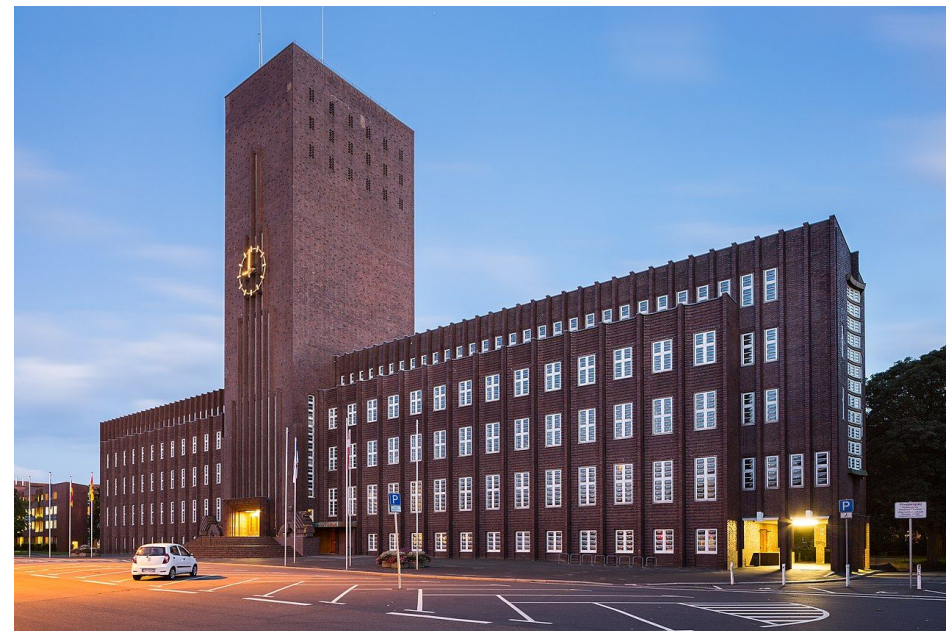
Ратуша Вильгельмсхафена (1929)