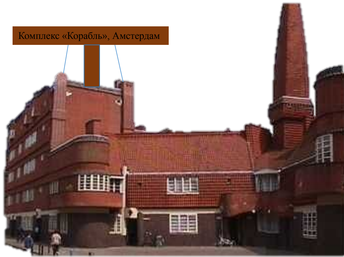
Комплекс «Корабль», Амстердам

Мишель де Клерк (нидерл. Michel de Klerk, МФА: 24 ноября 1884, Амстердам — 24 ноября 1923, Амстердам) — нидерландский архитектор еврейского происхождения, один из основоположников архитектурного движения XX века, основывавшегося на индивидуализме, фантазии и живописности, а также внимательном отношением к традициям голландского фольклорного зодчества, известного как «Амстердамская школа».