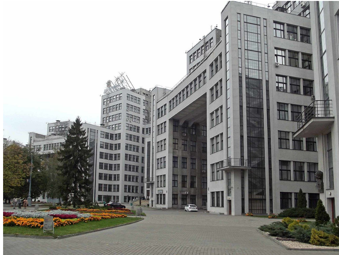
Украина, Харьков. Госпром. Архитекторы С. Серафимов, С. Кравец, С. Фельгер (1928 г.)

Конструктивизм — направление в изобразительном искусстве, архитектуре, фотографии и декоративно-прикладном искусстве, зародившееся в 1915 году и существовавшее в течение первой половины 1930 годов в СССР, затем в ряде других стран, прежде всего, в Германии (Баухаус) и Голландии (Де Стейл). В некоторых случаях конструктивизм рассматривают как источник и составляющую часть интернационального стиля и как одно из течений, определивших развитие Нового видения.