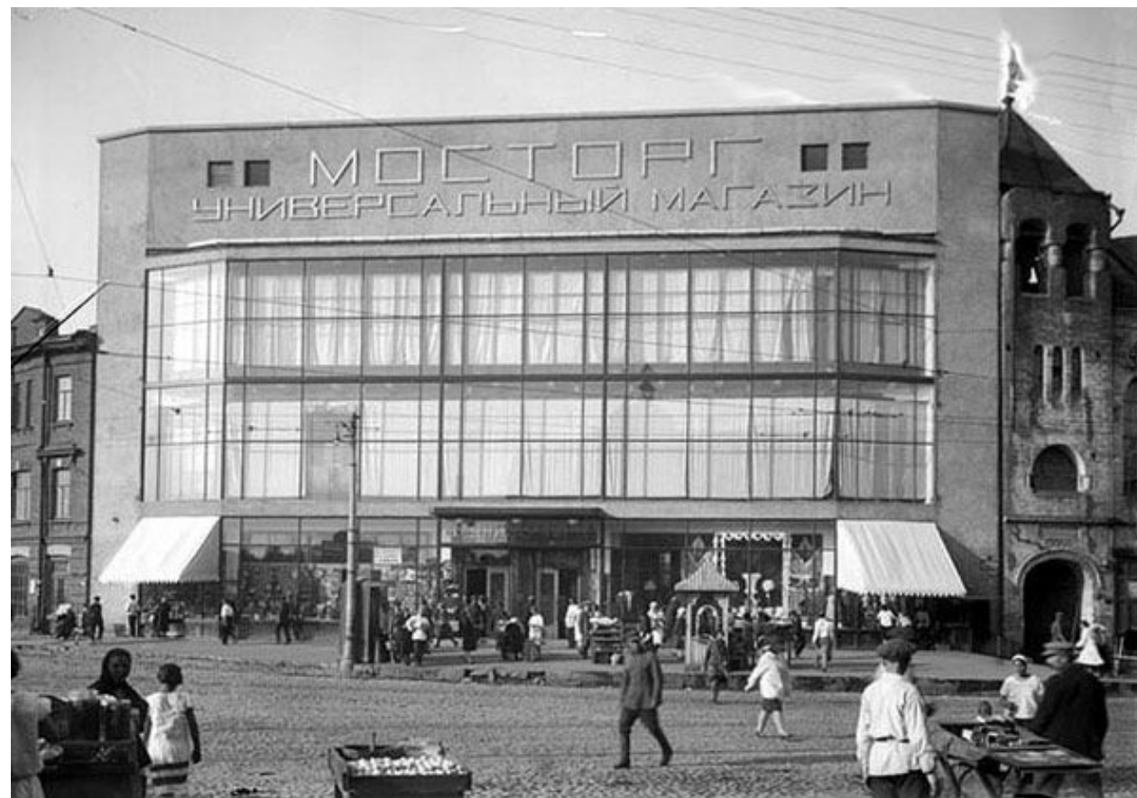
Универсальный магазин Мосторга на Красной Пресне в Москве