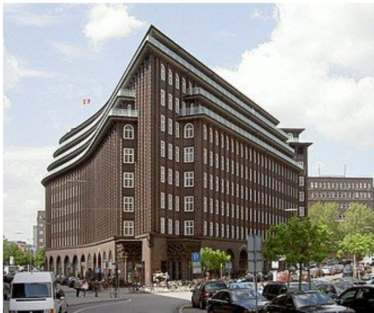
Чилехаус в Гамбурге (1924)

Кирпичный экспрессионизм (нем. Backsteinexpressionismus) — обозначение для особого варианта архитектурного экспрессионизма с использованием кирпича, который был характерен для Германии 1920-х годов. В основном данный стиль был распространён в больших городах Северной Германии и в Рурской промышленной области. Помимо этого, амстердамская школа также использовала данный архитектурный стиль, впоследствии распространившийся и на другие регионы.