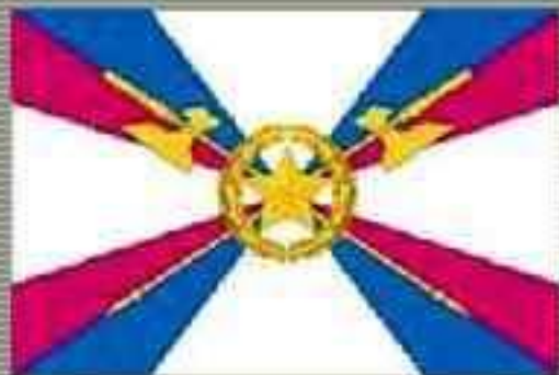
Тыл Вооруженных Сил