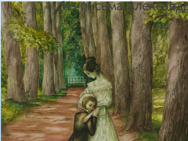
Из письма Александра Пу

«Когда я увидел ее [Наталью Гончарову] в первый раз, красоту ее только что начинали замечать в обществе. Я ее полюбил, голова у меня закружилась, я просил ее руки. Ответ ваш, при всей его неопределенности, едва не свел меня с ума; в ту же ночь я уехал в армию. Вы спросите меня — зачем? Клянусь, сам не умею сказать; но тоска произвольная гнала меня из Москвы: я бы не мог в ней вынести присутствия вашего и ее».