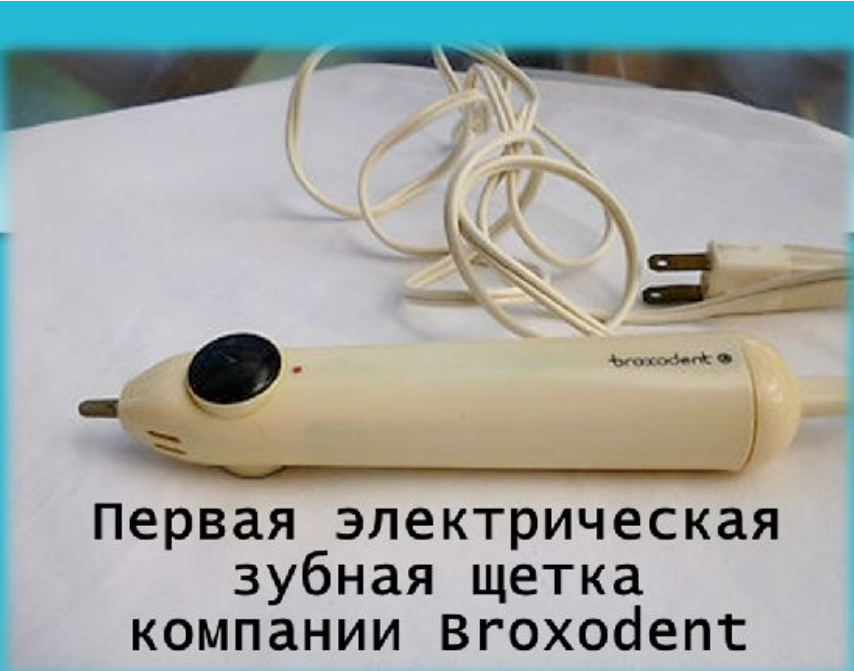
Первая электрическая зубная щетка компании Broxodent

Также стоит отметить и первое появление электрической зубной щётки. Она называлась Broxodent и была предложена Squibb Pharmaceutical ещё в 1959 году.