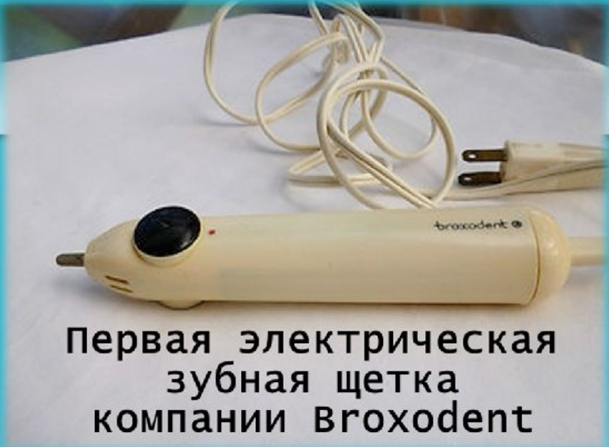
Первая электрическая зубная щетка компании Broxodent

Также стоит отметить и первое появление электрической зубной щётки. Она называлась Broxodent и была предложена Squibb Pharmaceutical ещё в 1959 году.