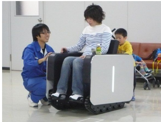
Инвалидное кресло с функцией управления взглядом