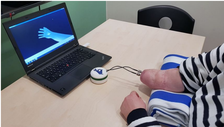
Протез с ощущением прикосновения