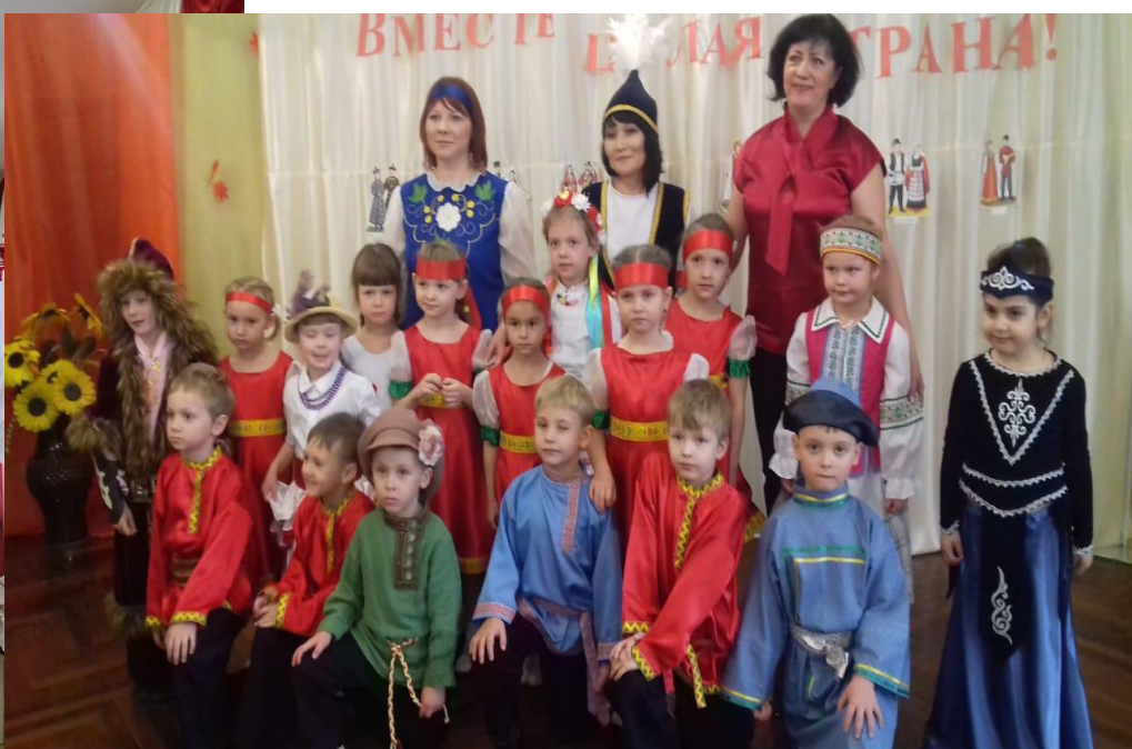
Акция «Я, ты, он, она – вместе целая страна» в детских садах