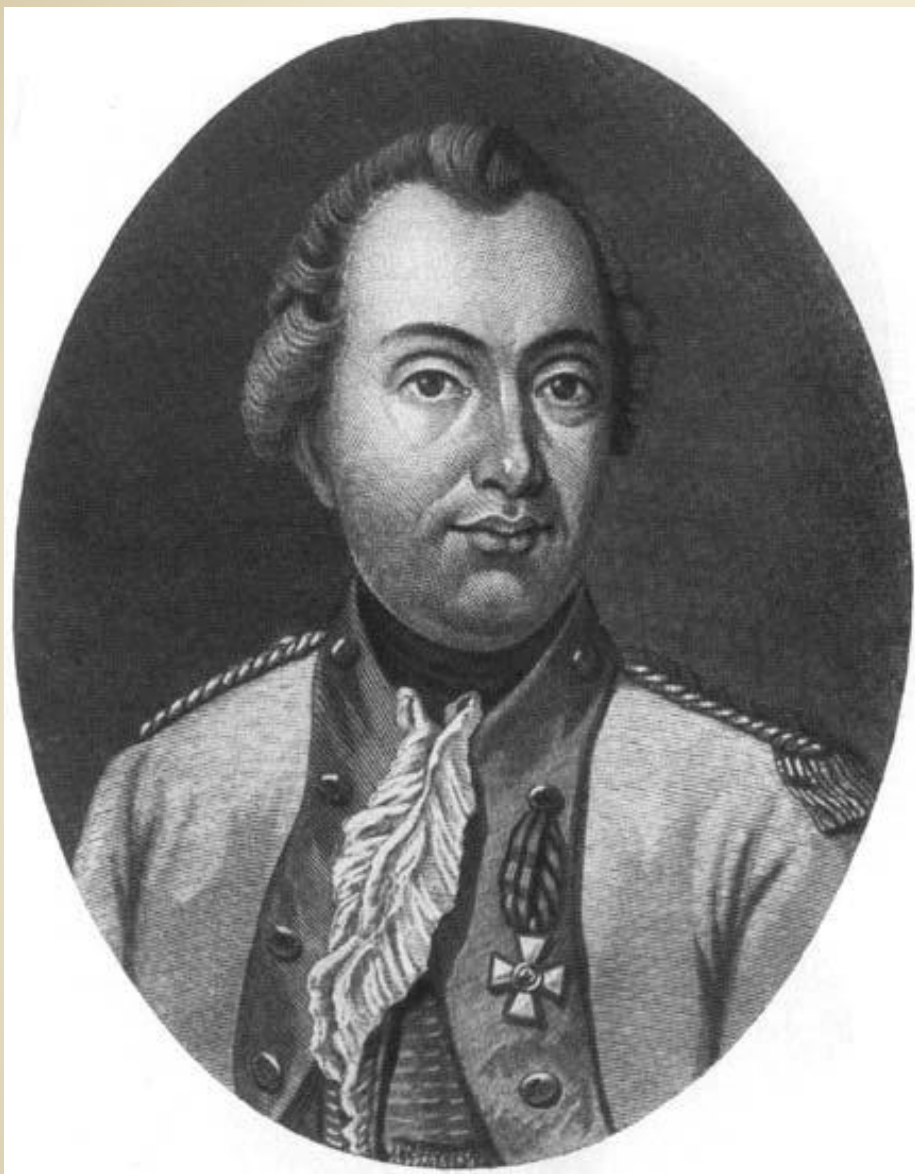
М.И. Кутузов 1774 год

Особая история – с ранениями Михаила Кутузова, русского полководца, главнокомандующего русской армией во время Отечественной войны 1812 года.