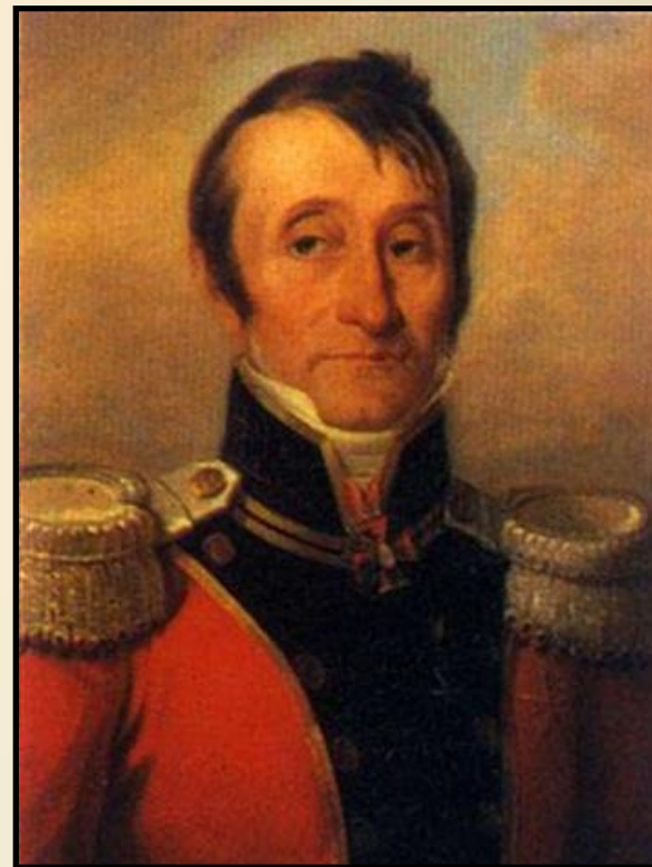
Я. В. Виллие

Главный полевой хирург французской армии Доминик-Жан Ларрей достиг необычайной скорости и автоматизма, тратил на ампутацию семь минут.