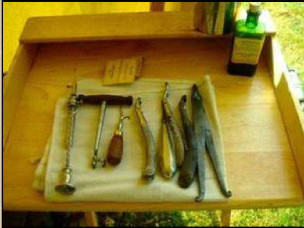
Хирургические инструменты времён Бородинской битвы

Оперируя на поле боя, хирурги не успевали даже мыть свои инструменты. Стерилизация инструментов в виде хотя бы кипячения была неизвестна совсем.