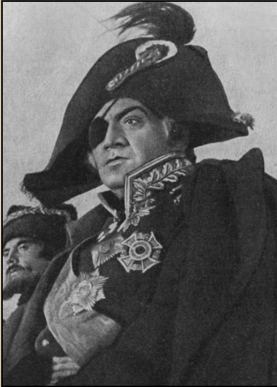
М.И. Кутузов 1812 год

18 августа 1787 году Кутузов снова был ранен в голову, в то же место.