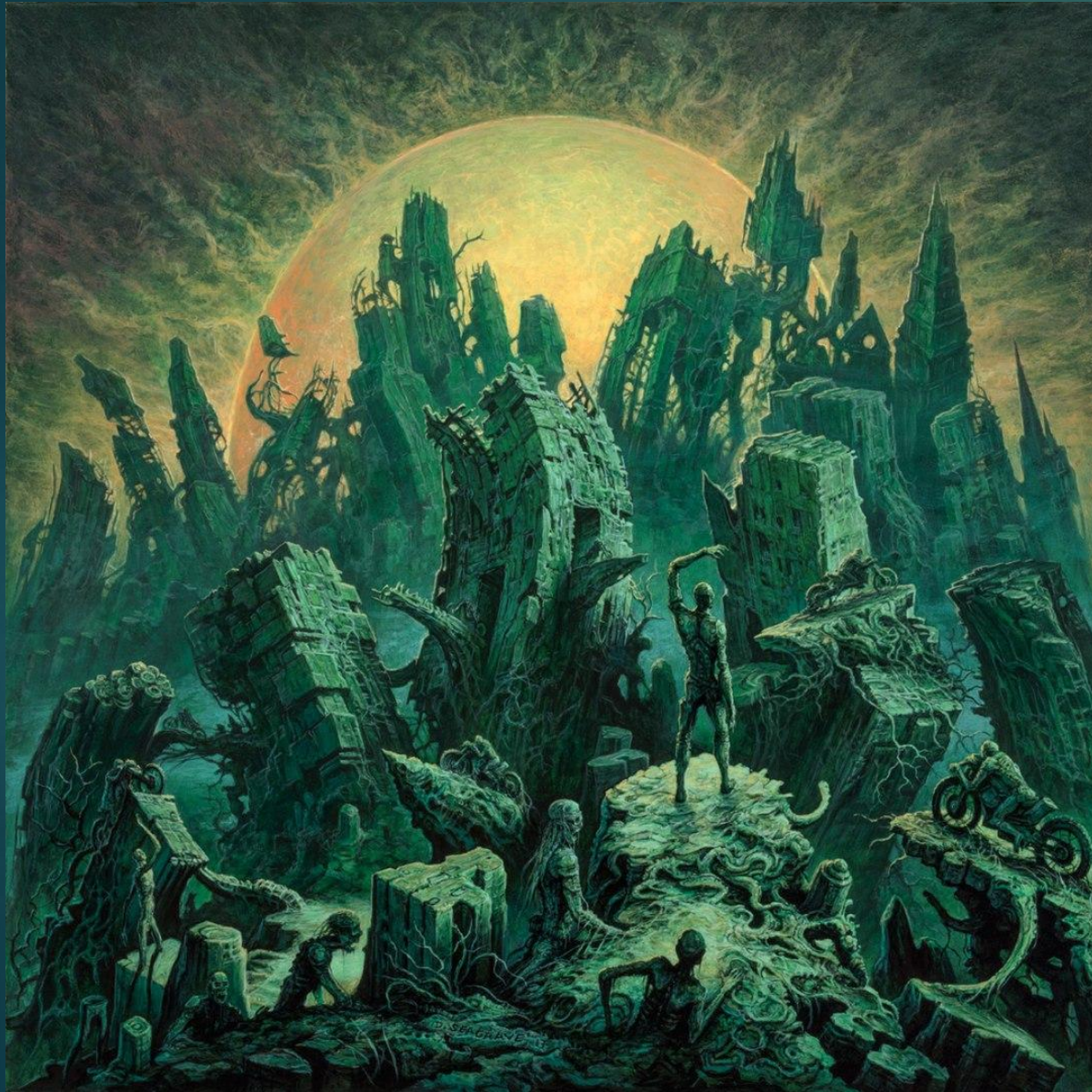
Stortregn – Emptiness Fills The Void (2018)