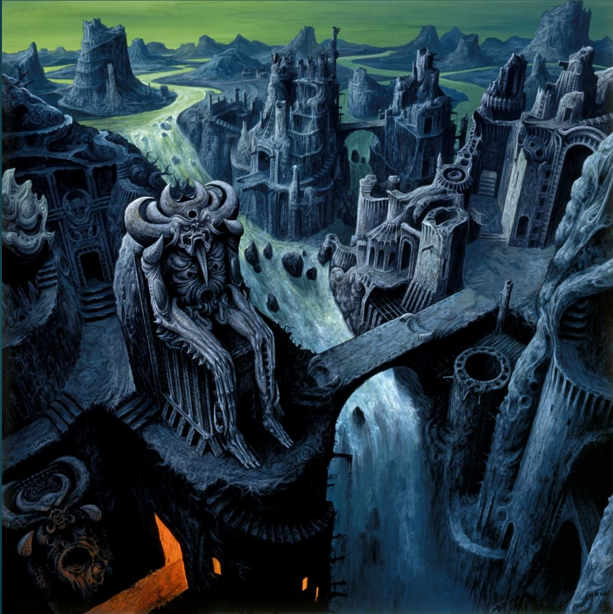
Carnage – Dark Recollections (1990)