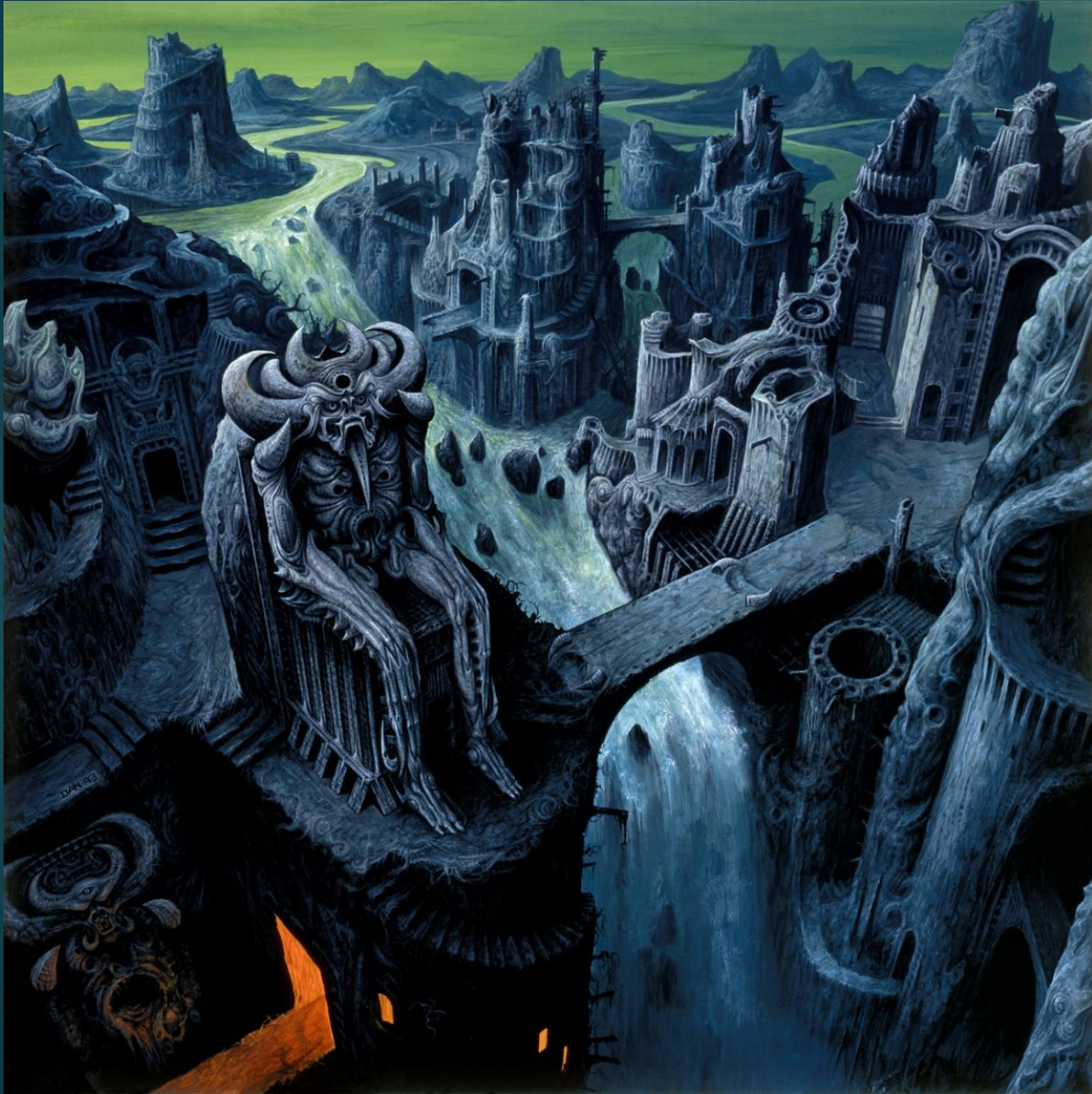
Benediction – Transcend the Rubicon (1993)