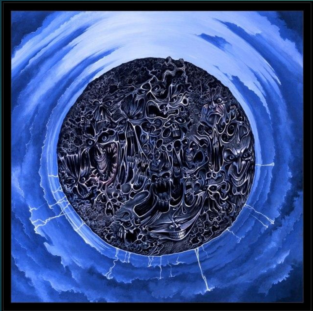
Morbid Angel – Altars of Madness (1989)