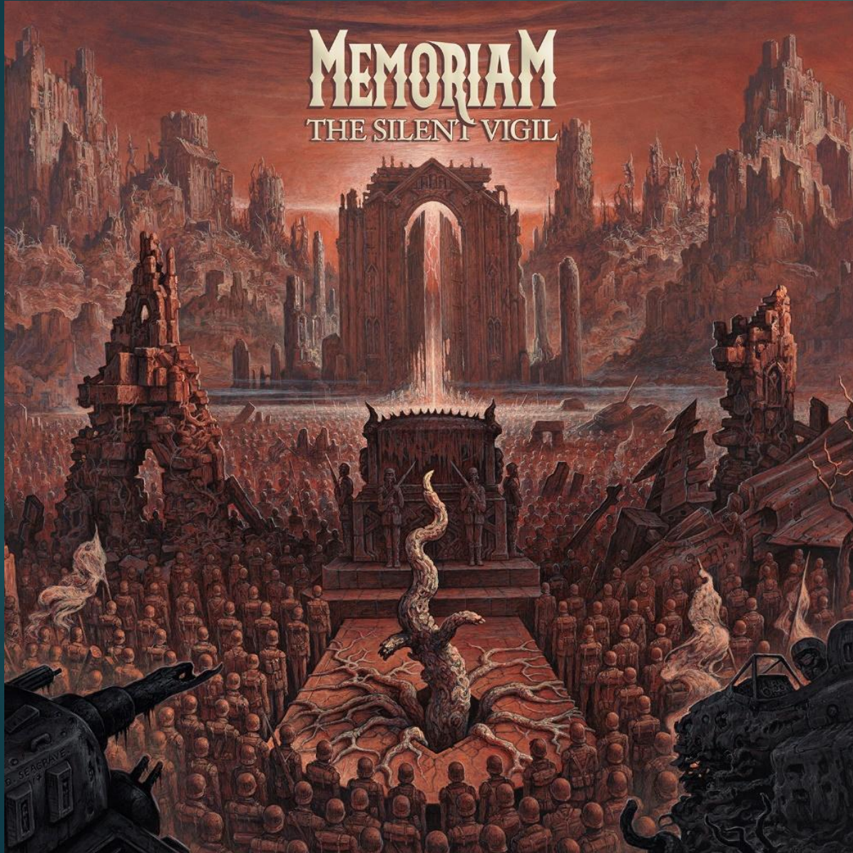
Memoriam – The Silent Vigil (2018)