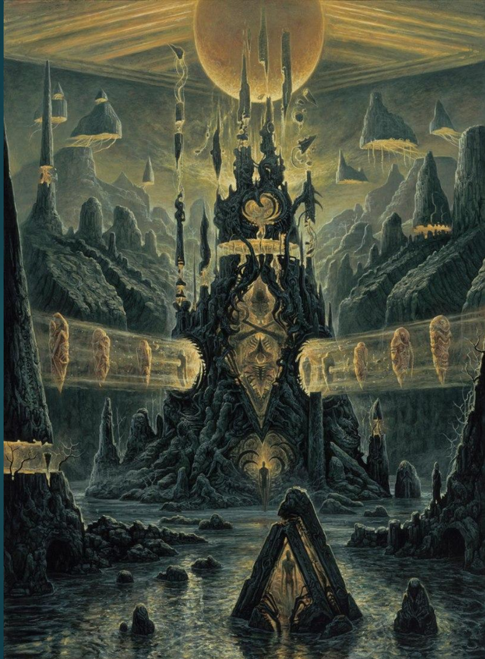
«Ожидание» The Pending (2017)