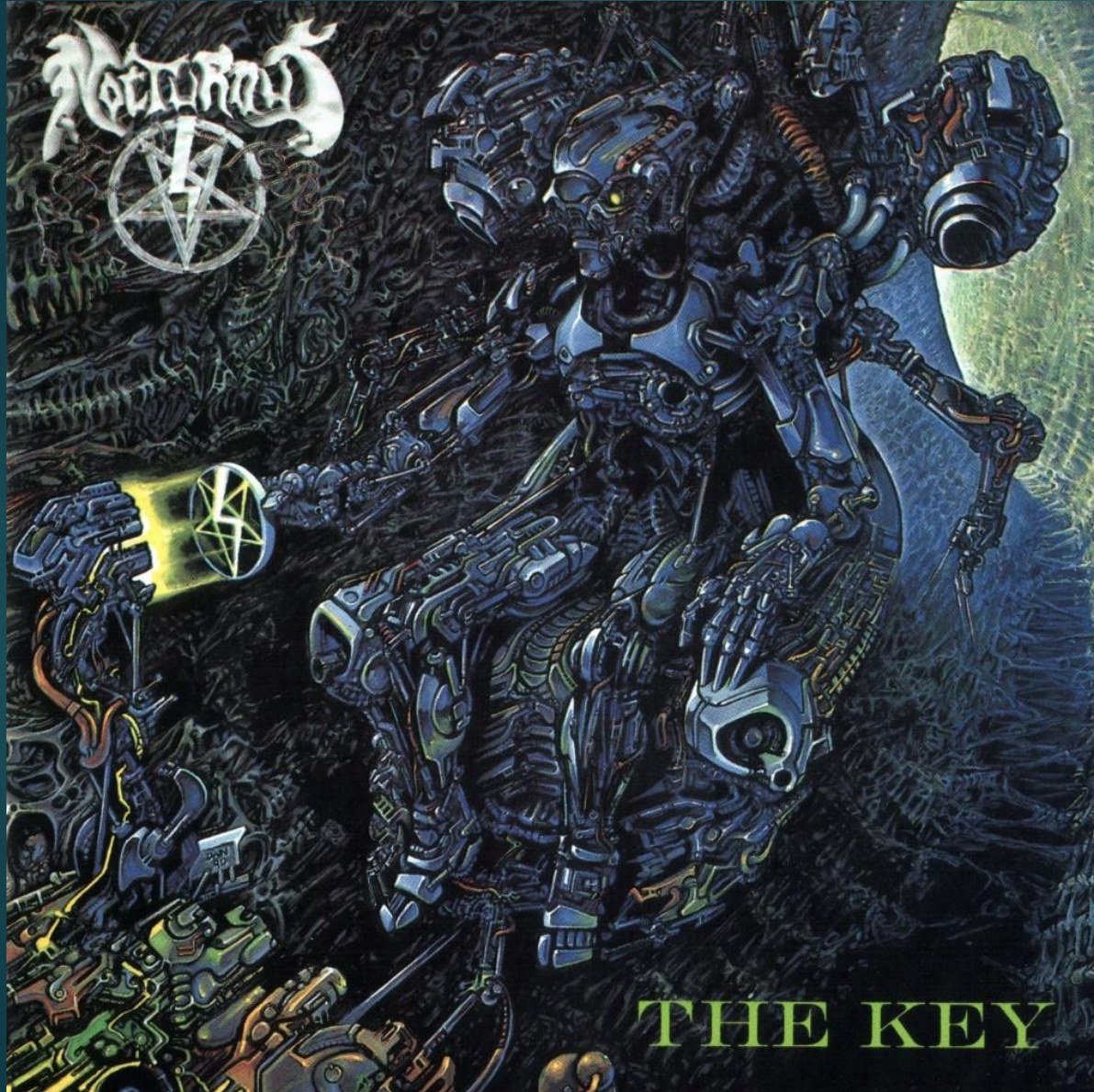
Nocturnus – The Key (1990)