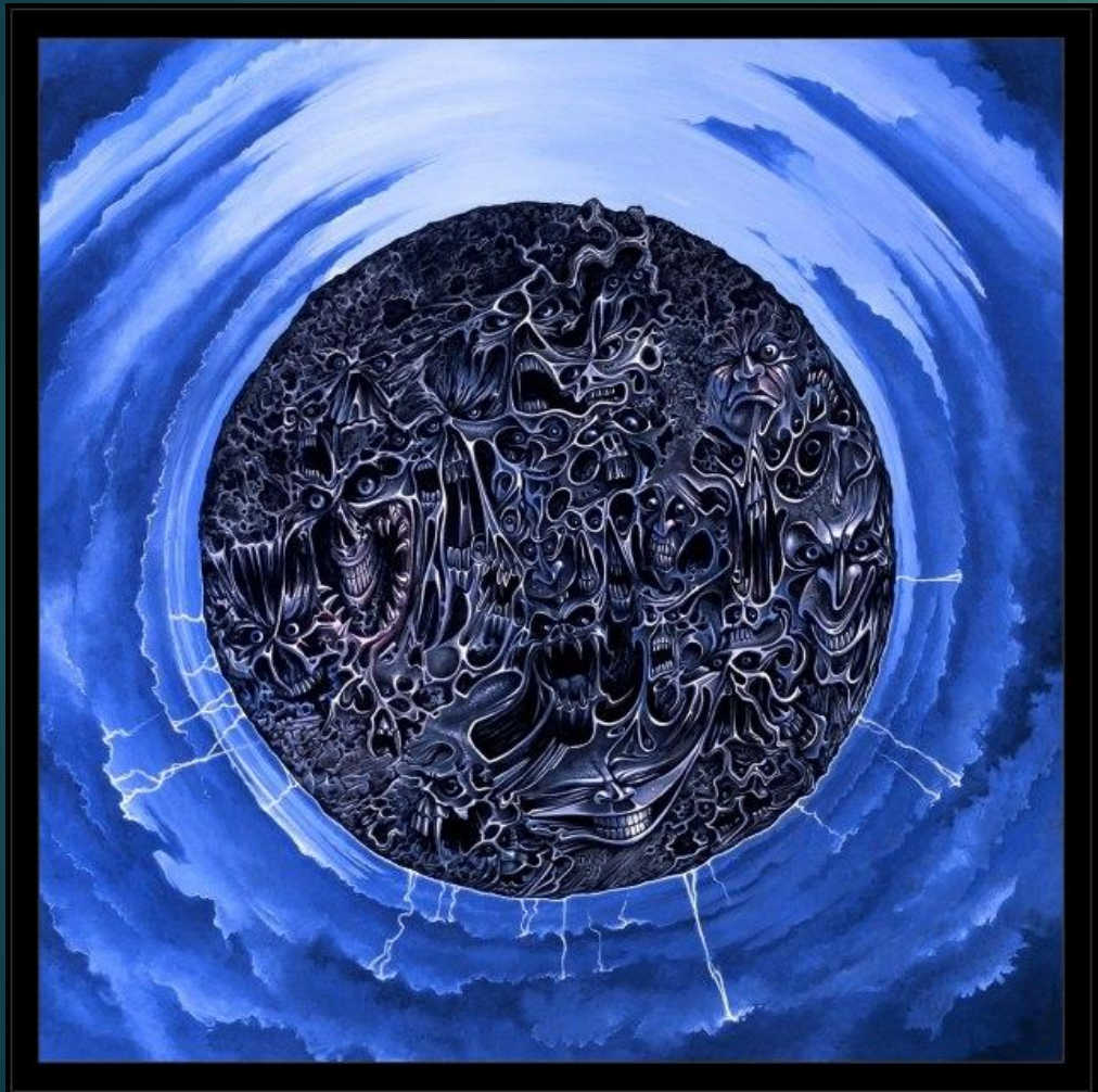
Entombed – Left Hand Path (1990)