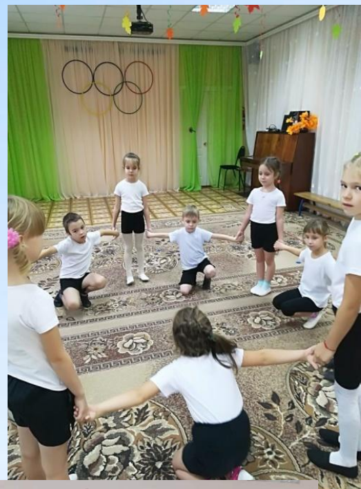
Спорт- ребятам очень нужен, мы со спортом крепко дружим!!!