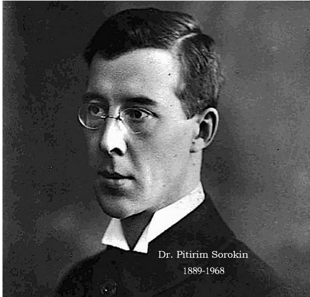
Dr. Pitirim Sorokin