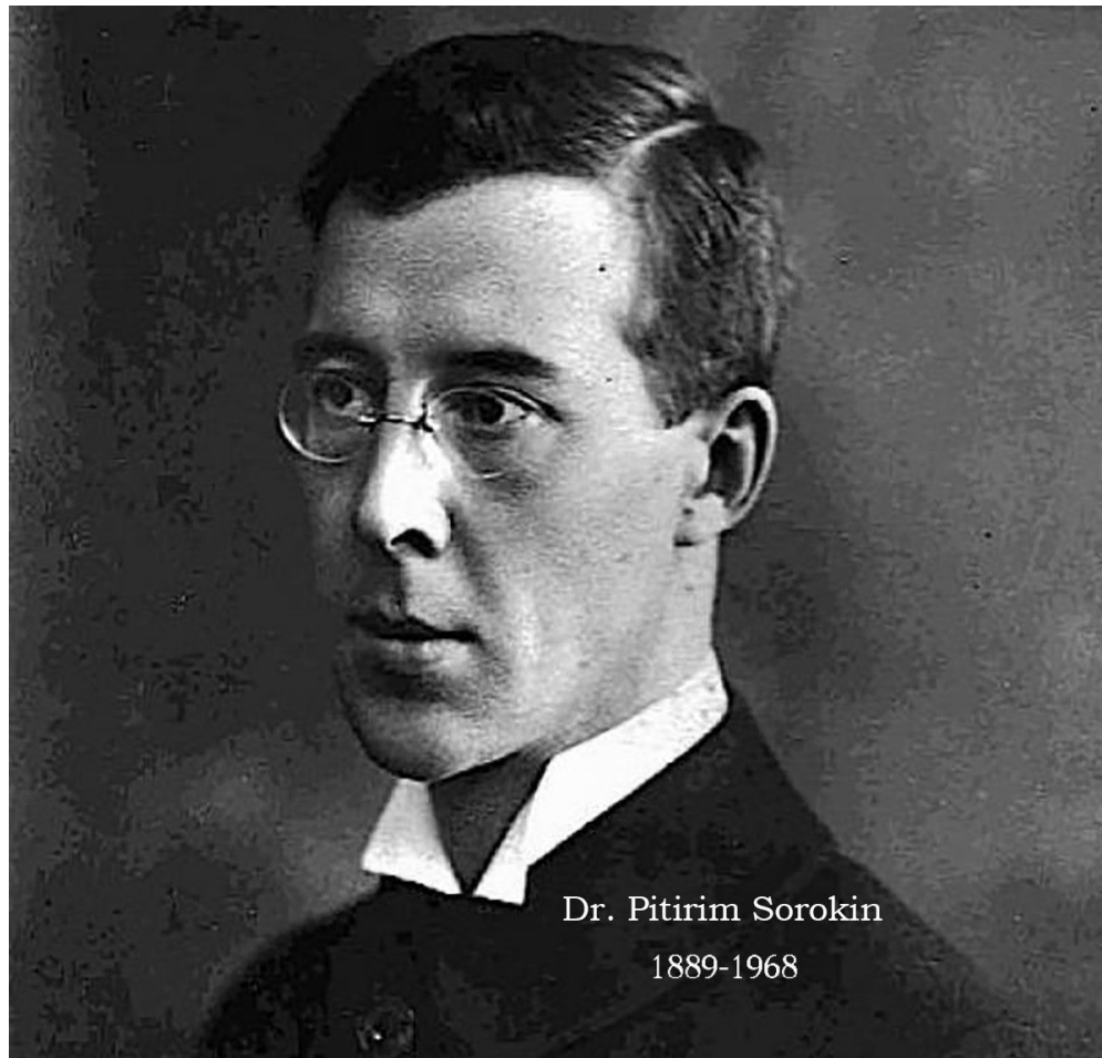
Dr. Pitirim Sorokin