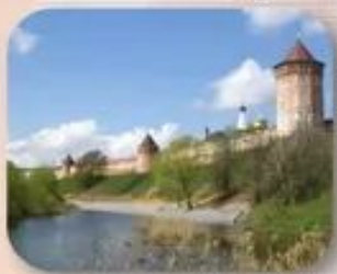
Нижегородский Печёрский монастырь