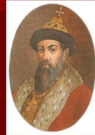
«Поучение Владимира Мономаха».